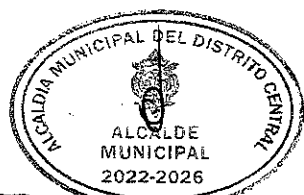
Figura 2 de 27 CONSTRUCCIONES SA de CV.