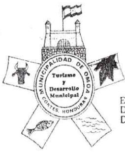
ESCUDO DE ARMAS DE MUNICIPALIDAD DE OMOA