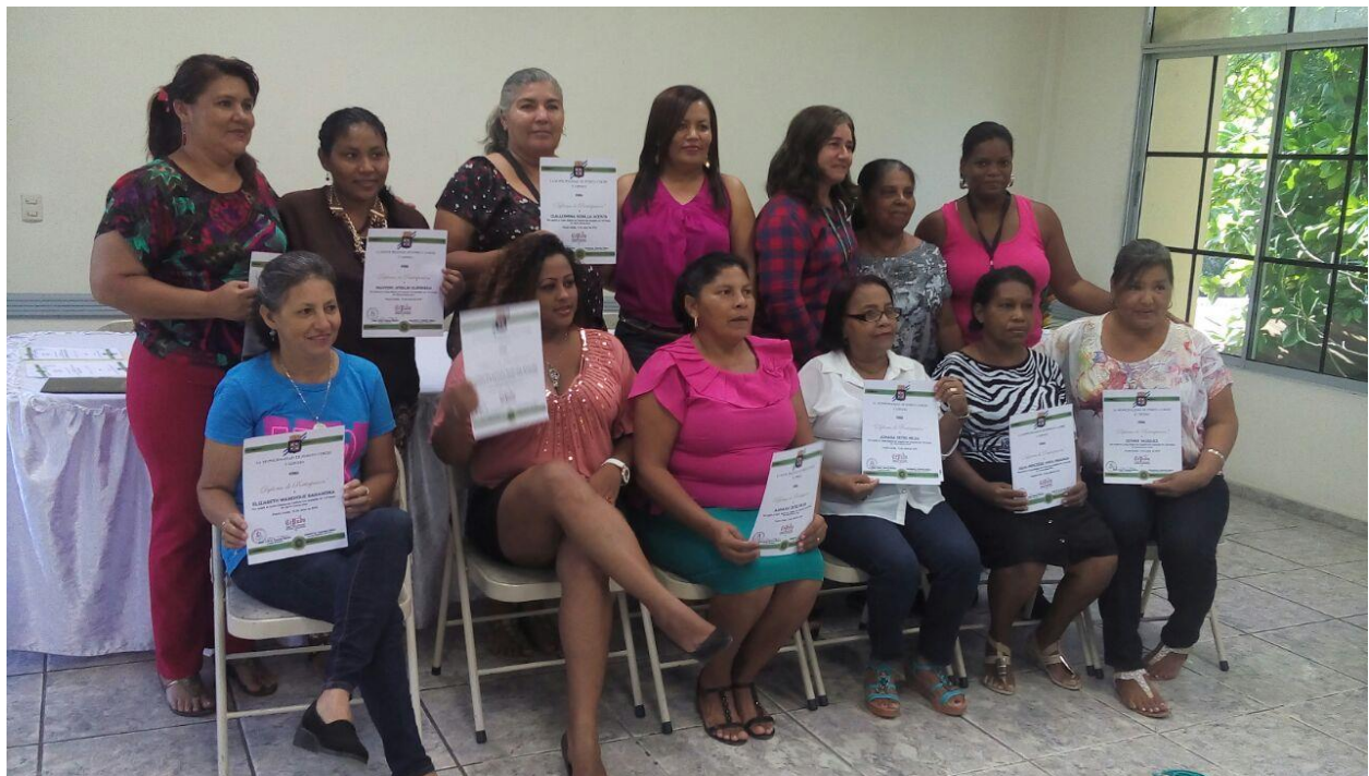
Ilustración 2. Taller de Costura impartido a grupo de mujeres del Barrio Buenos Aires y Bully Champa