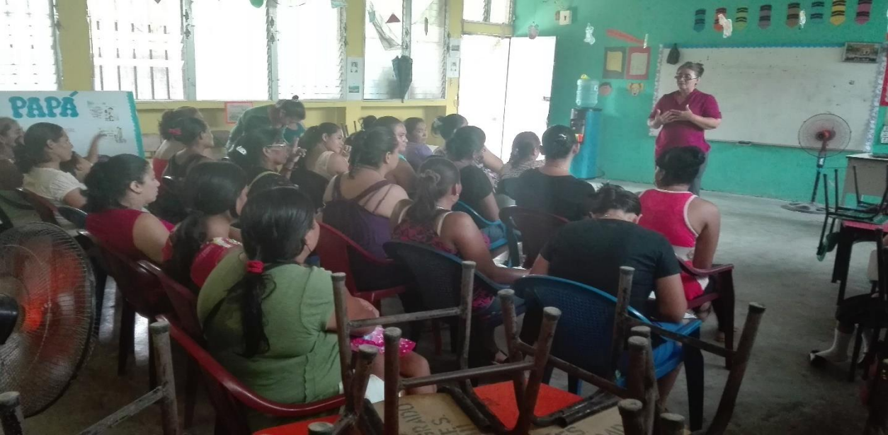
Ilustración 1. Campaña de sensibilización a red de mujeres del Municipio de Puerto Cortés a formar parte de orga Comunitarias