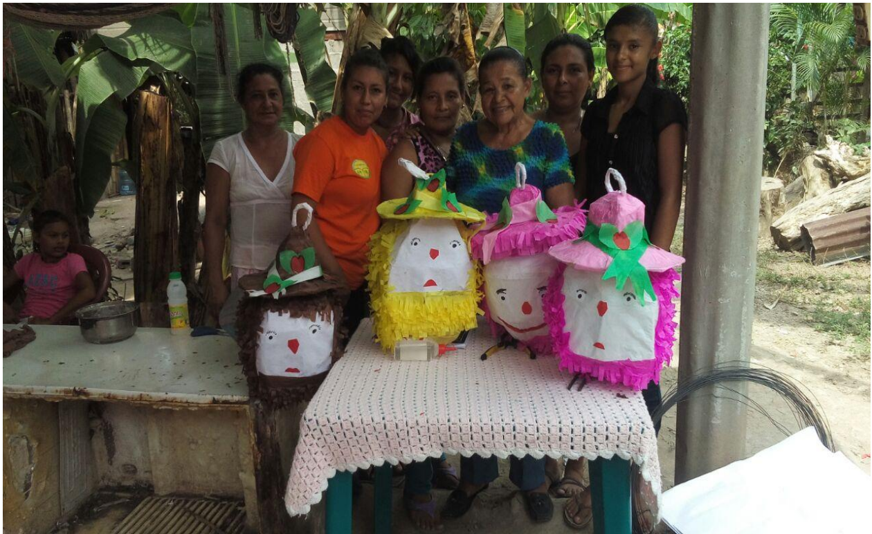
Ilustración 3. Curso de piñata a socias de Caja Rural Dios Proveerá, de la Aldea de Las 40