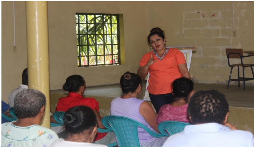
Ilustración 2 Charla de Autoestima/Brisas de Chamelecón

Programa Municipal de Bienestar y Salud mental impartiendo charla sobre Autoestima para las personas de la Tercera edad en la comunidad de Travesía.