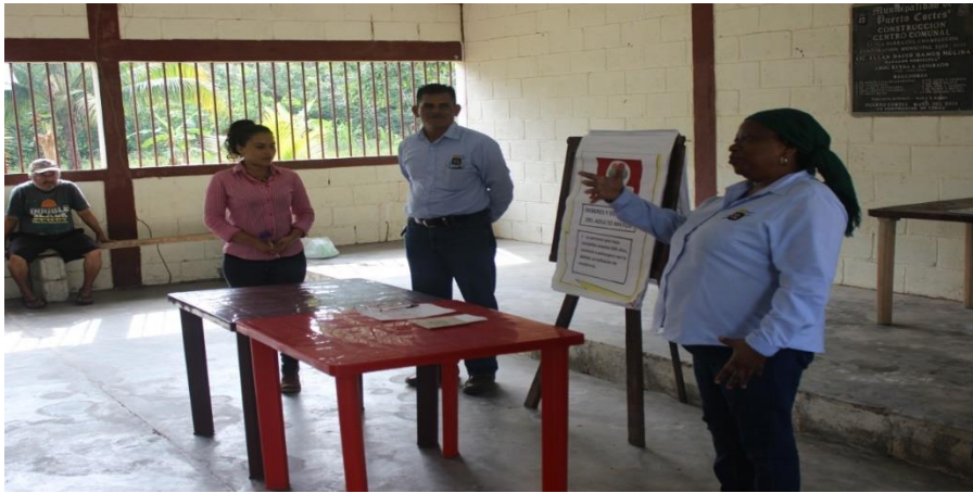
Ilustración 1 Charla Deberes y Derechos/Barra de Chamelecón

Con apoyo del Promotor social se realizó Charla sobre Deberes y Derechos del adulto según Ley en la comunidad de Bajamar.