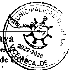
Fern Zelava Vice alcalde Municipalidad de Utila

A todas las empresas precalificadas en La Municipalidad de Utila PRECA - 001- 2023 en la categoría de obra Vial, se les notifica que a partir del 05 de junio de 2023, están disponibles las bases para la contratación de servicios de construcción de calle de Concreto Hidráulico Mamey Lane, Utila, Islas de la Bahía, las bases podrán descargarlas desde la página web: www.honducopras.gob.hn se realizara una visita de campo será opcional y se programara para el día 12 de junio de 2023 a las 10:30 am punto de encuentro en las oficinas de la municipalidad de Utila, las Ofertas deberán hacerlas llegar a la dirección: Edif. De La Municipalidad de Utila calle al aeropuerto, Barrio Jerusalén, Utila Islas de la Bahía, a las 10:30 am. Hora oficial de la república de Honduras el día 26 de junio de 2023, acto seguido se realizará la apertura de las ofertas en presencia de cada uno de los representantes de los oferentes en las oficinas de La Municipalidad de Utila. Cualquier consulta favor comunicarse mediante email a la siguiente dirección municipalidadutila@yahoo.com o llamar al teléfono 2425-3615-8861-5951.