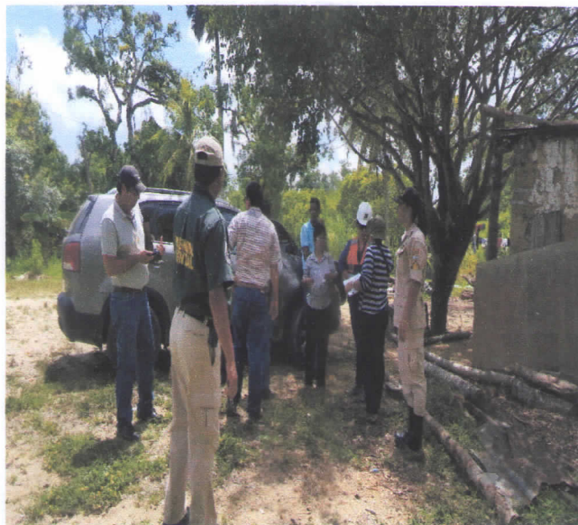
VISITA TÉCNICA EN COORDINACIÓN CON EL DEPARTAMENTO MUNICIPAL AMBIENTAL, A SOLICITUD DE PERMISO PARA LOTIFICACIÓN ALDEA LA CONCORDIA.