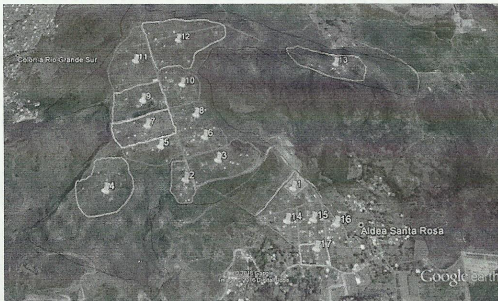
Foto 1.2 Número de Sectores delimitados por CONVIVIENDA en la Colonia Lomas del Diamante.

De acuerdo a las fotos 1.1 y 1.2, el levantamiento recientemente realizado por el IP confirma que los 17 sectores previamente identificados por CONVIVIENDA están dentro de la delimitación predial. Es acertado concluir que la totalidad de viviendas habitables que se podrían considerar para reasentar asciende a 287 viviendas. La delimitación predial de la Foto 1.2 contempla todo lo que está dentro de la línea azul.