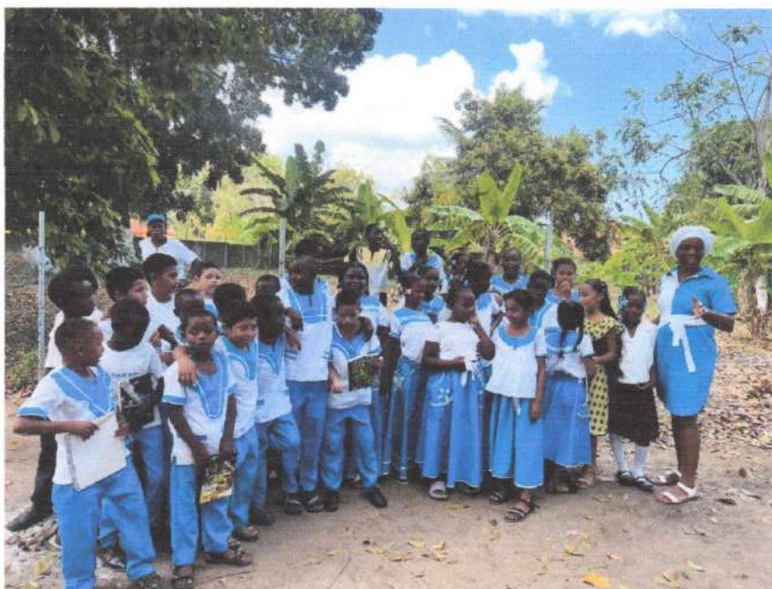
Niños organizados para cantar el himno en garífuna