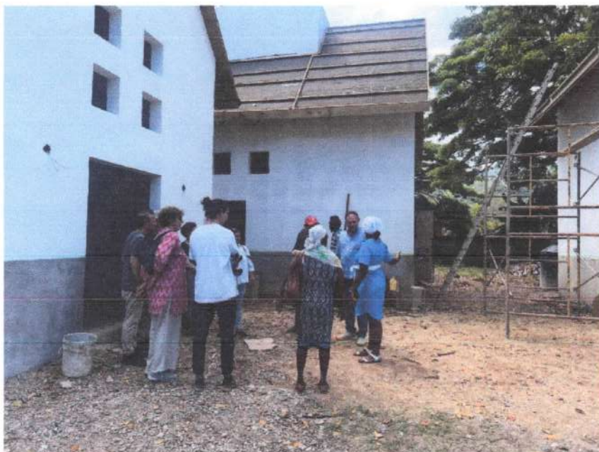
Coordinador de proyecto AECID con personal de visita patrimonio