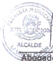
Abogado. Víctor Hugo Alvarado Alcalde Municipal

Extendida en La Unión Copan a los 14 días del mes de abril del año 2023.