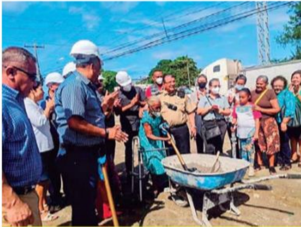
Maestros colocando la primera piedra de la Casa del Maestro en Puerto Cortés.