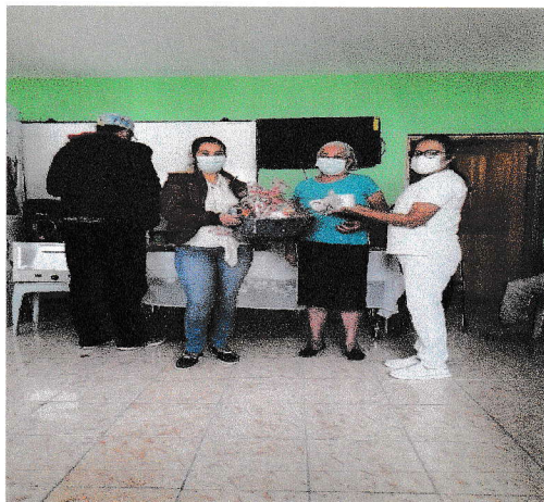
Apoyo a salud