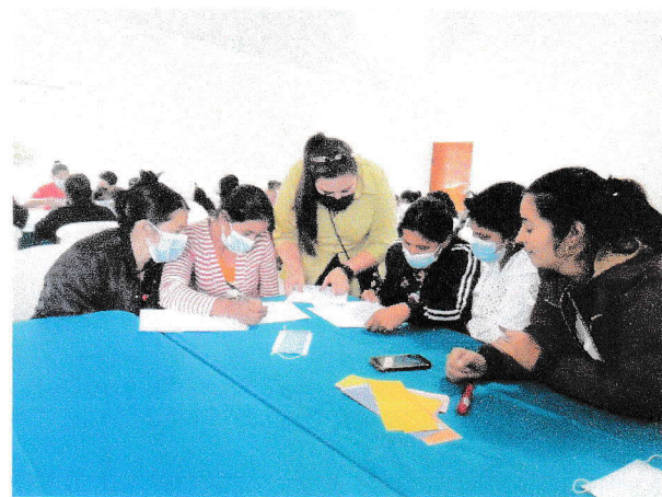
Evaluación sobre Tecnología