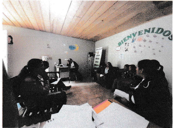
Encuentro regional OMM en Ruinas de Copan