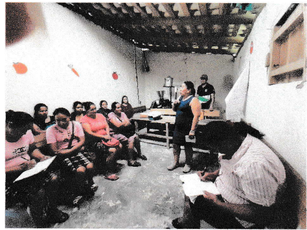
Reunión en Tontolos