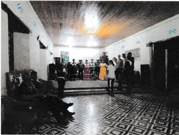
Tardeada cultural con CASM