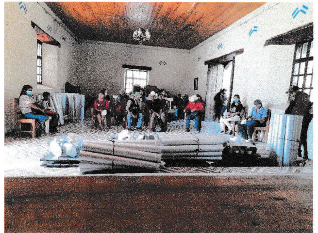
Entrega de fogones