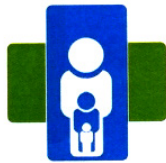
MEDICENTRO SAN RAFAEL