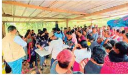
La iniciativa "Empresarios Unidos por el Valle de Sula" entregó entre lunes y martes más de 2 mil kits de alimentación a igual número de familias afectadas por "Julia".

En las donaciones también participan empresas enfocadas en la responsabilidad social como Fuznázucar, Jaremar, Unilever, Fundación Mhotive y Cepudo, que igualmente promueven las acciones conjuntas y la reconstrucción resiliente, con el objetivo de mitigar el impacto y aliviar la difícil situación que están viviendo muchas familias en el Valle de Sula.