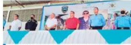
Autoridades que asistieron ayer al lanzamiento de las Mesas de Seguridad Ciudadana en Tela.

En el lanzamiento, realizado en el Gimnasio Polideportivo, estuvieron