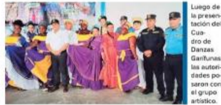
Luego de la presentación del Cuadro de Danzas Garífunas, las autoridades posaron con el grupo artístico.