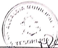
MAYRA ROSIBELT ZEPEDA VILLANUEVA TESORERA MUNICIPAL