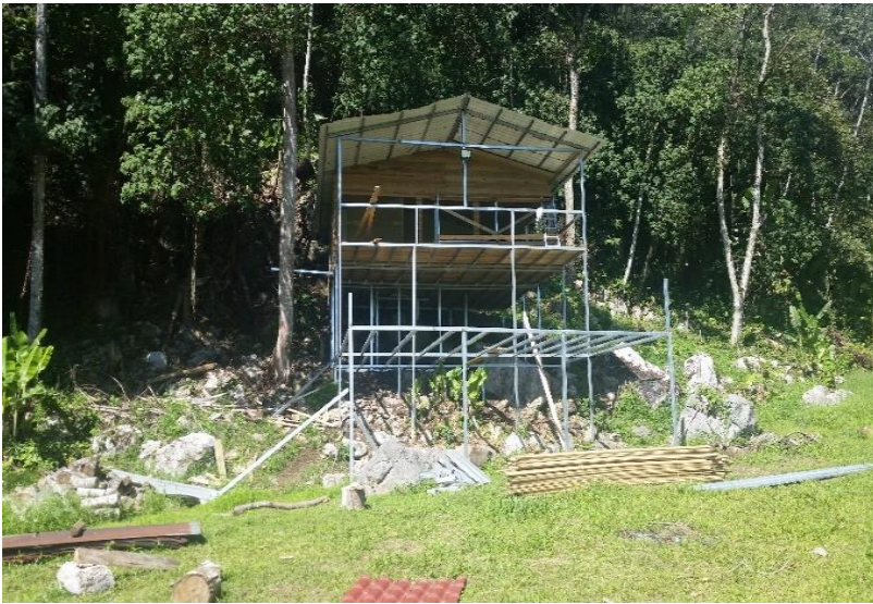
Cabaña # 1