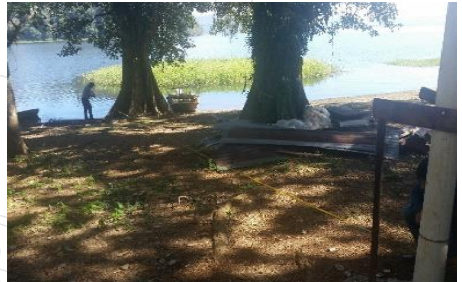
Verificando 100 metros.