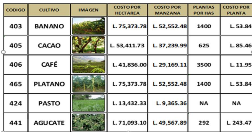
Tabla para la valorización de cultivos permanentes