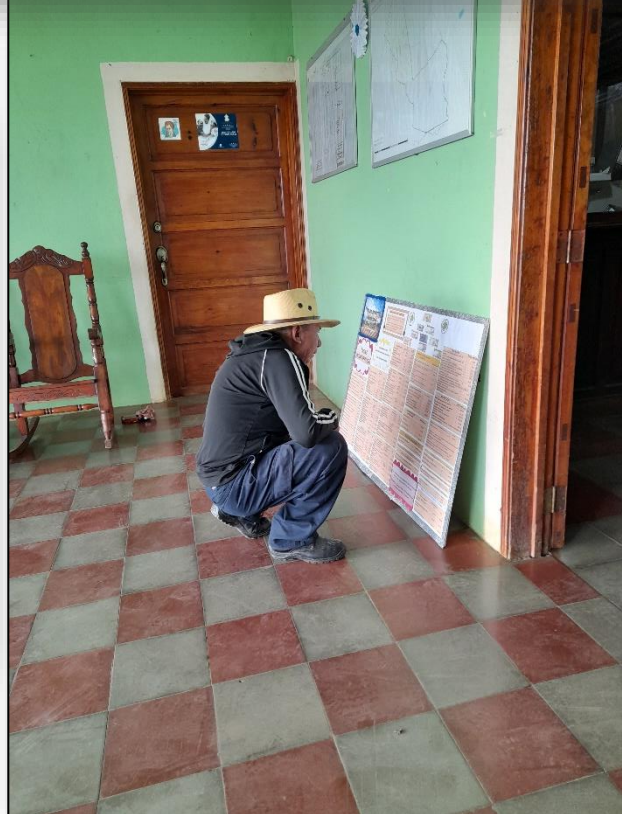
Plan de Arbitrios Año 2023