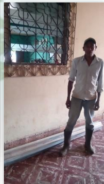
(supervisión de jornal en arreglo de calles, entrega de 10 lamininas de zinc a caja rural.)