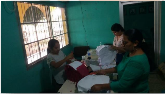
(Elaboración de piñatas para el día del niño)