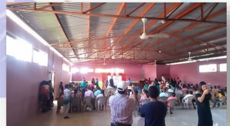
(Colaboración con el trámite de la alimentación en las bodas municipales)