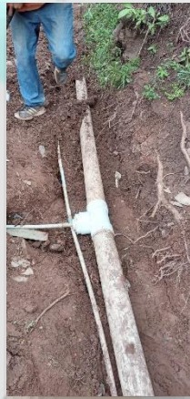
(supervisión de jornales en arreglo de sistema de agua potable.)