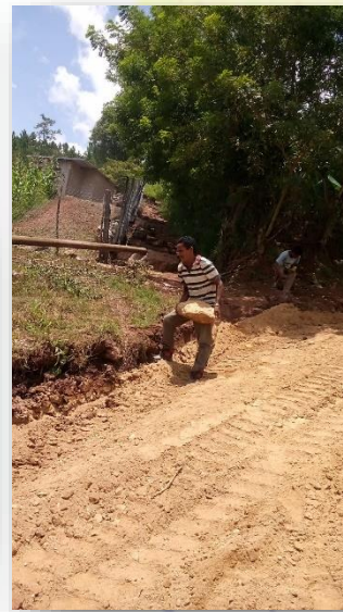
(supervisión de jornal en arreglo de calles)