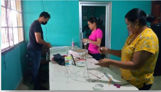
(Entrega de herramientas a patronato, elaboración de piñatas para el día del niño.)