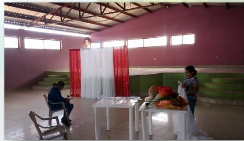
(ayuda en decoración para las bodas municipales)