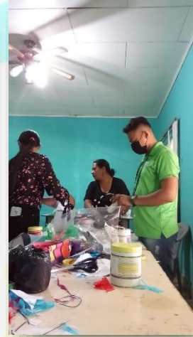
(Elaboración de piñatas para el día del niño)