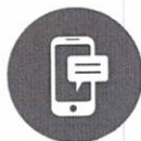
Mensajería Instantánea y Reuniones Online

Obtén correo de clase empresarial con un buzón de 50 GB por usuario y envía adjuntos de hasta 150 MB.