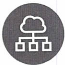
Intranet y sitios de grupo

Obtén, 1 TB de almacenamiento en la nube de OneDrive para editar y compartir documentos, fotos y mucho más desde cualquier lugar y en todos tus dispositivos.