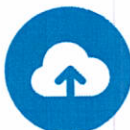
1TB de Almacenamiento seguro en la nube por usuario

Chatea, reúnete y colabora con Microsoft Teams. Combina mensajes, llamadas de voz, videollamadas y disponibilidad en una aplicación.