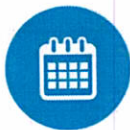
Correo y Calendarios