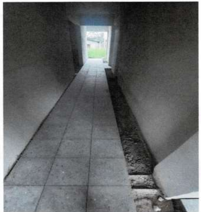
PISO GRANITO EN PASILLOS DEL LABORATORIO