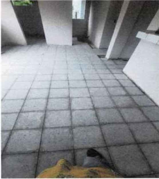
PISO GRANITO TERRAZO DE 30 X 30 EN LA SALA DE ESPERA Y SERVICIOS SANITARIOS