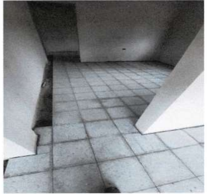
PISO GRANITO TERRAZO EN AREA DE FARMACIA, AREA DE ADMICION Y ARCHIVO