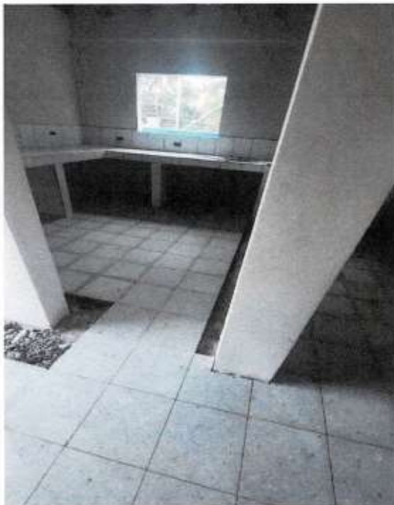
PISO GRANITO TERRAZO EN SALA DE RESEPCION Y TOMA DE MUESTRAS