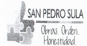
TABLA DE BIENES INMUEBLES DE LA MUNICIPALIDAD DE SPS