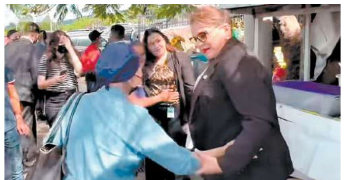
La Presidenta Xiomara Castro camino hacia donde se encontraban los puestos de flores en el Jardín de Paz Suyapa para saludar y abrazar a su pueblo que le pedían una foto para tener una recuerdo de ella.