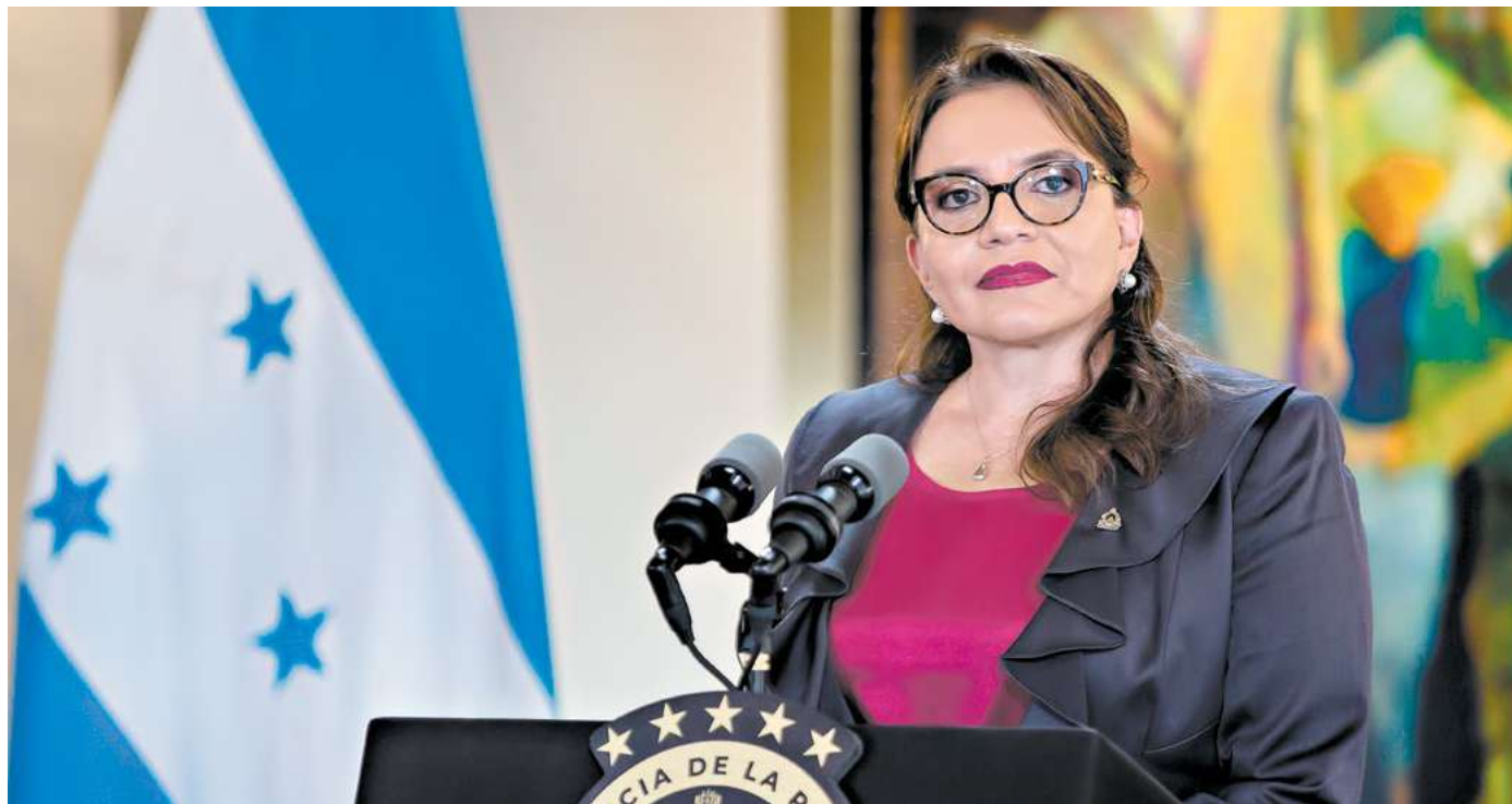
La Presidenta Xiomara Castro disertará por Zoom en la Cumbre sobre el Cambio Climático a realizarse en Egipto del 7 al 18 de noviembre.

“Debemos entrar en las negociaciones de Cambio Climático sabiendo que las responsabilidades son compartidas pero diferenciadas”, explicó.