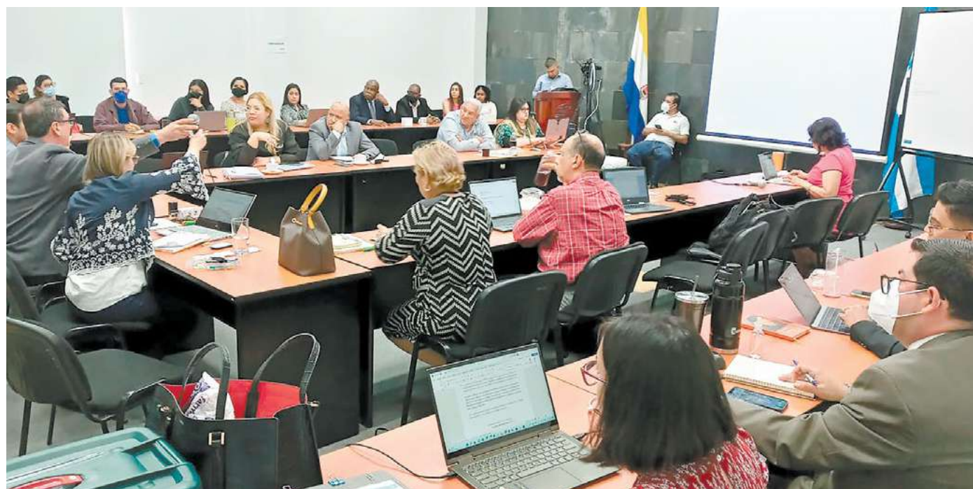
La Junta Nominadora en pleno trabaja arduamente en la atención a los postulantes y la elaboración de lo que serán las pruebas psicométricas de los aspirantes.

La Junta Nominadora trabaja a la vez en la estructuración de las pruebas psicométricas que se aplicarán a los postulantes que hayan entregado todos sus documentos, para lograr una mayor idoneidad en los nominados a magistrados. "Hemos estado discutiendo con los especialistas las diversas pruebas