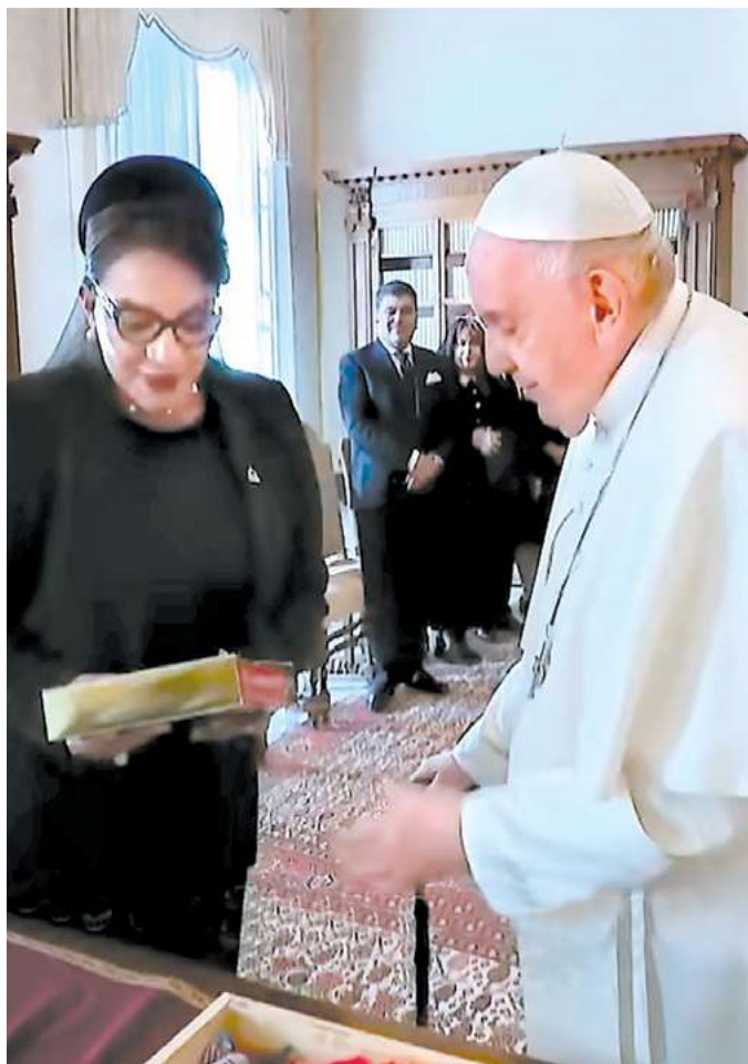
La obra literaria de 813 páginas es uno de los obsequios que la Presidenta Xiomara Castro llevó a Su Santidad el Papa Francisco y hoy es parte de la colección privada de la Biblioteca del Vaticano.

mujeres hondureñas deben leer su libro? Es que este libro no lo escribí para las mujeres hondureñas, lo escribí para la colectividad social, que no tiene que ver con mujeres u hombres. Es para cualquiera que tenga un sentido común social, que tenga interés en la literatura. Las mujeres lógicamente tienen que ver en ese libro el espejo en el que puedan ver reflejada su imagen y el potencial que tienen las mujeres. Con ese libro al leerlo, ellas se van a empoderar, entender que, así como Xiomara llegó al poder, ellas también pueden llegar al poder.