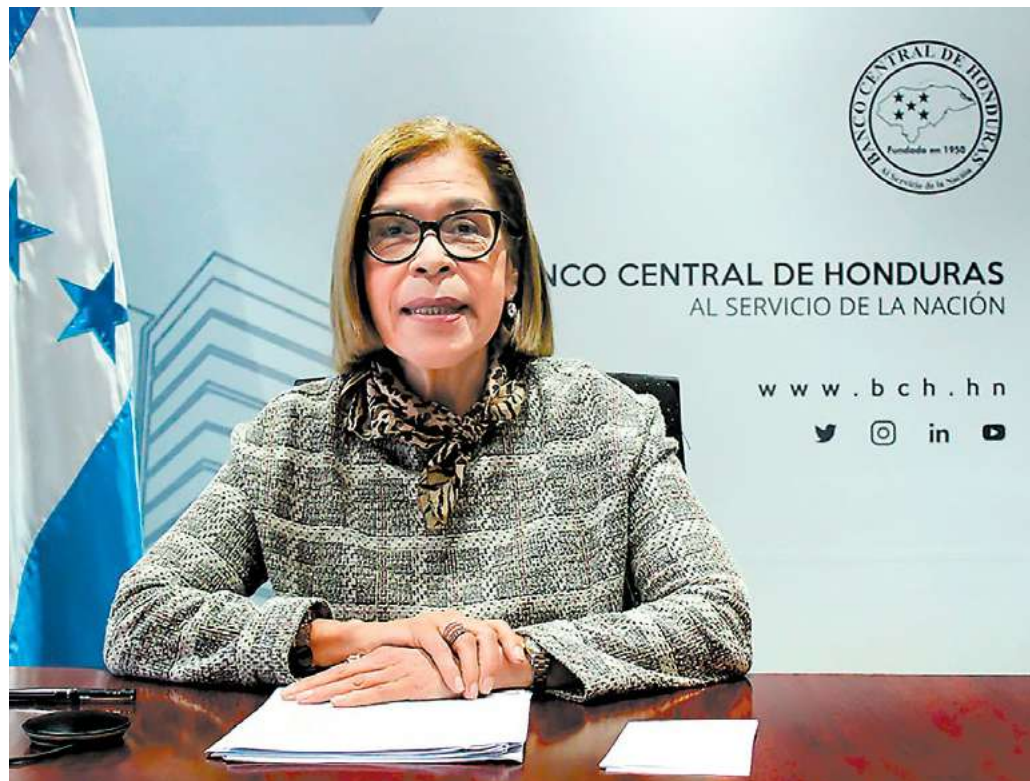
Rebeca Santos, presidenta del Banco Central de Honduras (BCH), señaló que el Gabinete Económico realiza un constante y permanente monitoreo de las economías mundiales.

Con base en la información publicada por el BCH, se detalla que la inflación estaba en 10.30% y ahora se redujo a 10.04%, gracias