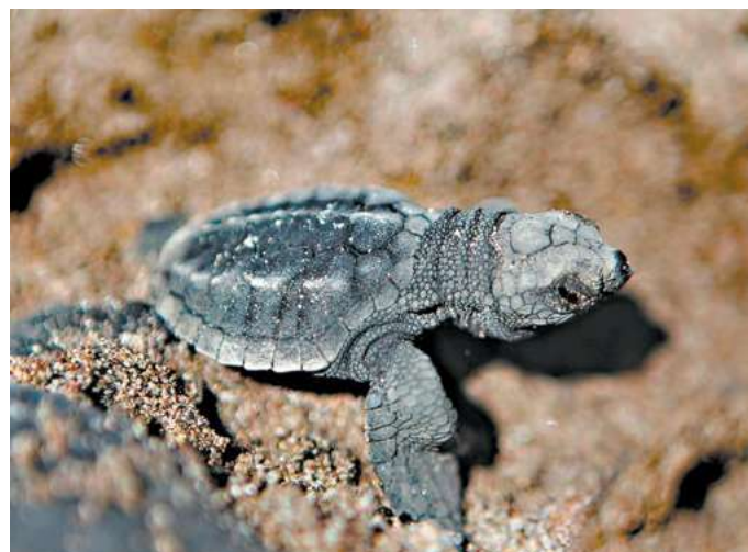
Así es el inquieto momento que enfrentan las tortugas cuando se ponen a caminar por la arena.