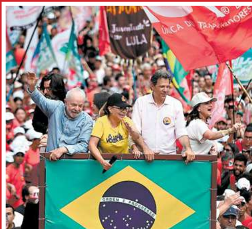
El nuevo presidente de Brasil se comprometió con su pueblo a luchar por una mayor inclusión y justicia social a favor de las clases más desposeídas de esa nación.