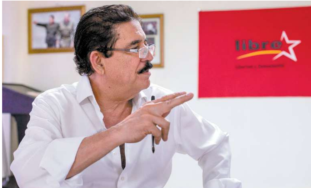
El expresidente Manuel Zelaya confirmó que la CICIH viene apoyar en la lucha contra la corrupción al Gobierno de la Presidenta Xiomara Castro.

El expresidente Zelaya también advirtió que se está dando seguimiento a grandes conspiraciones sobre intentos de golpe de Estado