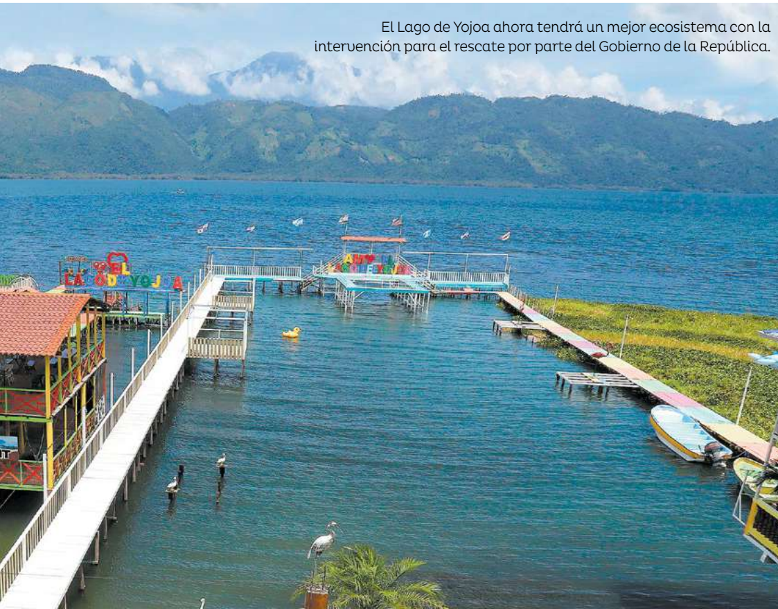
El Lago de Yojoa ahora tendrá un mejor ecosistema con la intervención para el rescate por parte del Gobierno de la República.