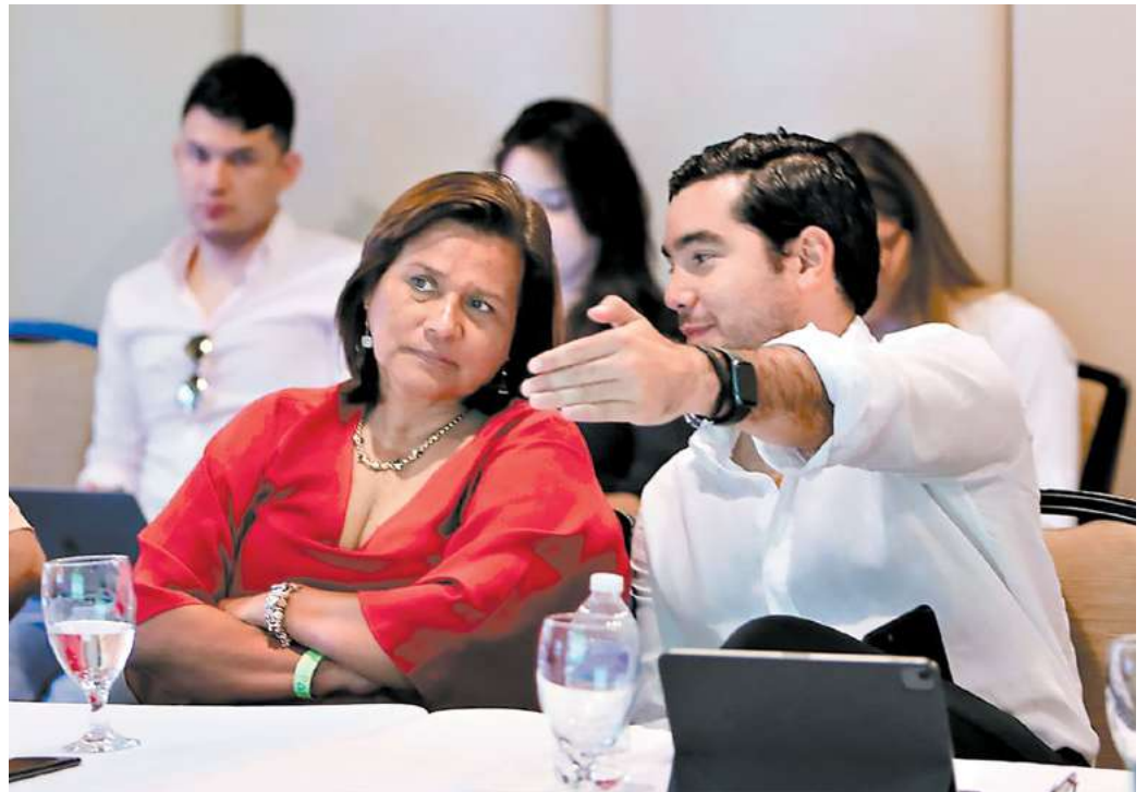
La ministra de Turismo, Yadira Gómez y el ministro del FHIS, Octavio José Pineda, se reunieron con los ingenieros e inversionistas para definir los detalles para la construcción de la carretera de El Progreso -Tela.

La ministra de Turismo y el ministro del FHIS, Octavio José Pineda, se reunieron con los ingenieros para despejar sus inquietudes, comprometiéndose en actualizar