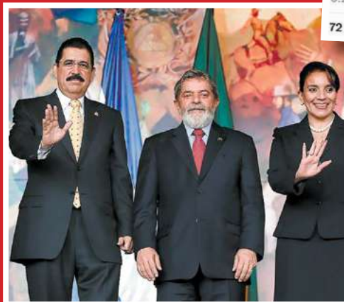
Lula da Silva en las gradas de Casa Presidencial junto a la Presidenta Xiomara Castro y el exmandatario Manuel Zelaya, durante una visita a Honduras realizada en 2007.