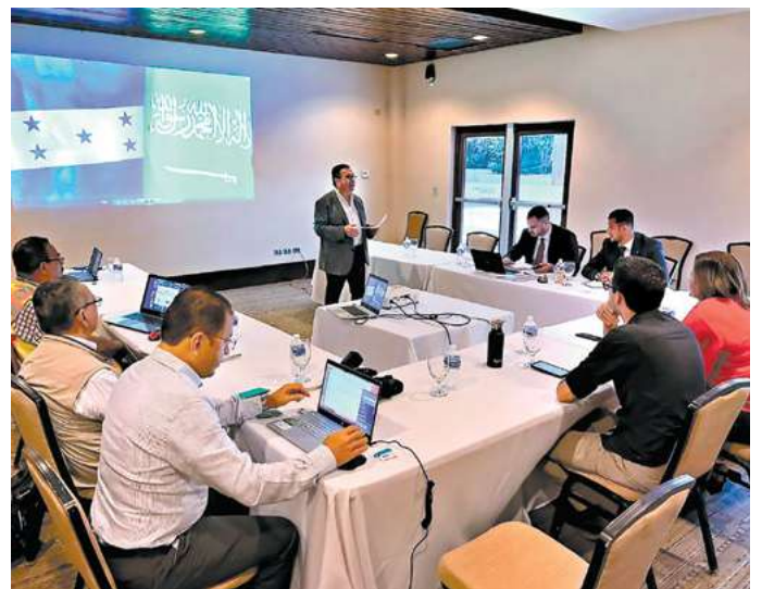
La presentación del croquis de la carretera con la firma consultora que la realizó, en un plazo de diez días para que los inversionistas árabes hagan su evaluación final.