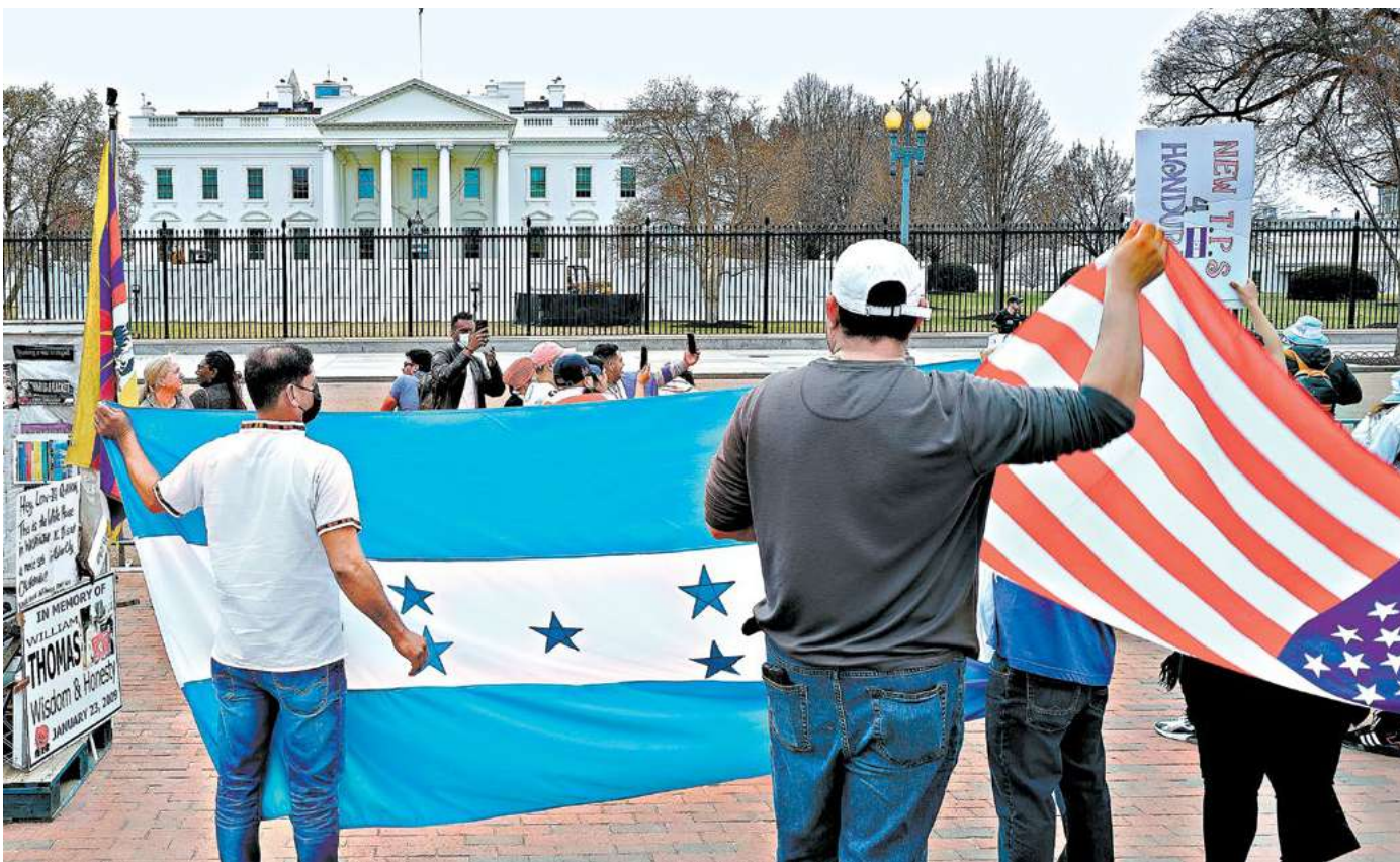
Migrantes de varios países incluyendo hondureños esperan mantener el Estatus de Protección Temporal (TPS) como un beneficio migratorio que otorga el Gobierno de los Estados Unidos.

Autoridades de la Secretaría de Relaciones Exteriores anuncian gestiones para la designación de un nuevo Estatus de Protección Temporal