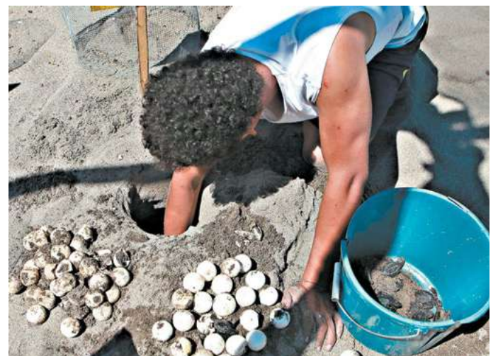
Este es el proceso para iniciar el desove que los expertos hacen para miles de tortugas.