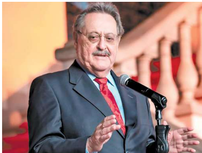
El Secretario de Transparencia Edmundo Orellana acompañará al Canciller Eduardo Enrique Reina en una misión a la sede de la ONU en Nueva York para la llegada de la CICIH a Honduras.

en el país aunque afirmó que los golpistas no tienen ninguna posibilidad.