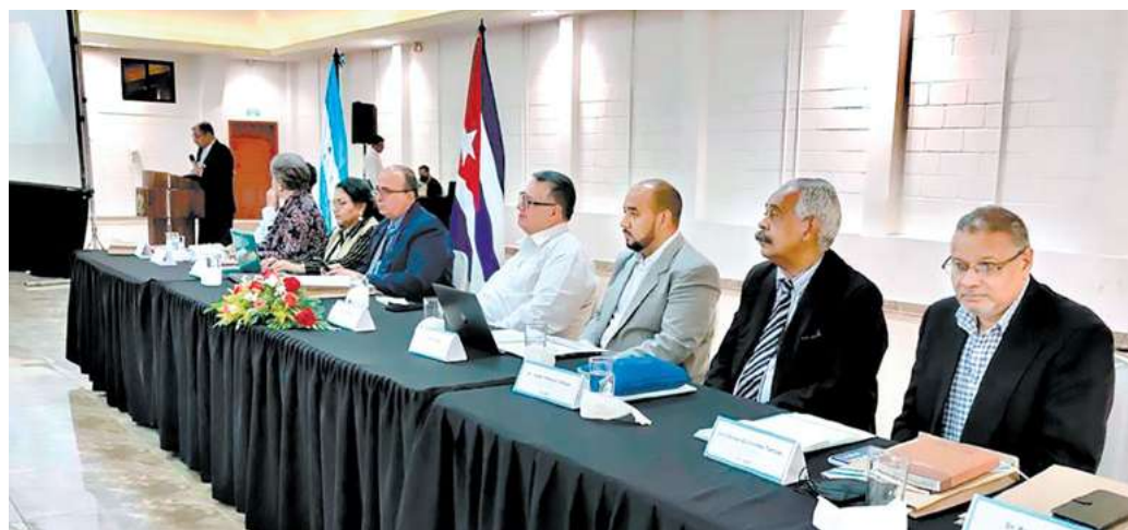
La Secretaría de Planificación Estratégica realizó el foro “Cátedra Morazánica” con un panel de expertos en materia educativa e histórica, a fin de proponer una visión en el contexto de la Refundación de la Educación en Honduras.