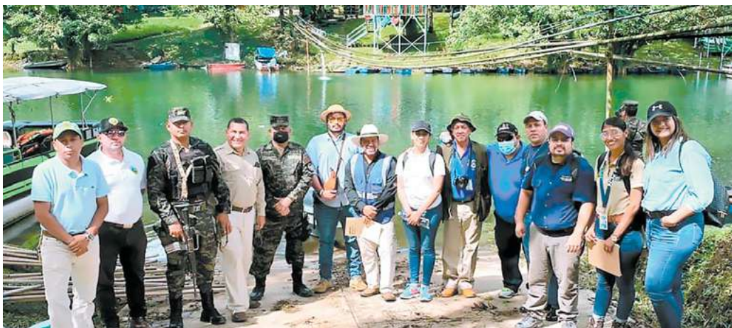
Este grupo de técnicos se desplazan por todas las áreas donde hay las denominadas lechugas acuáticas.