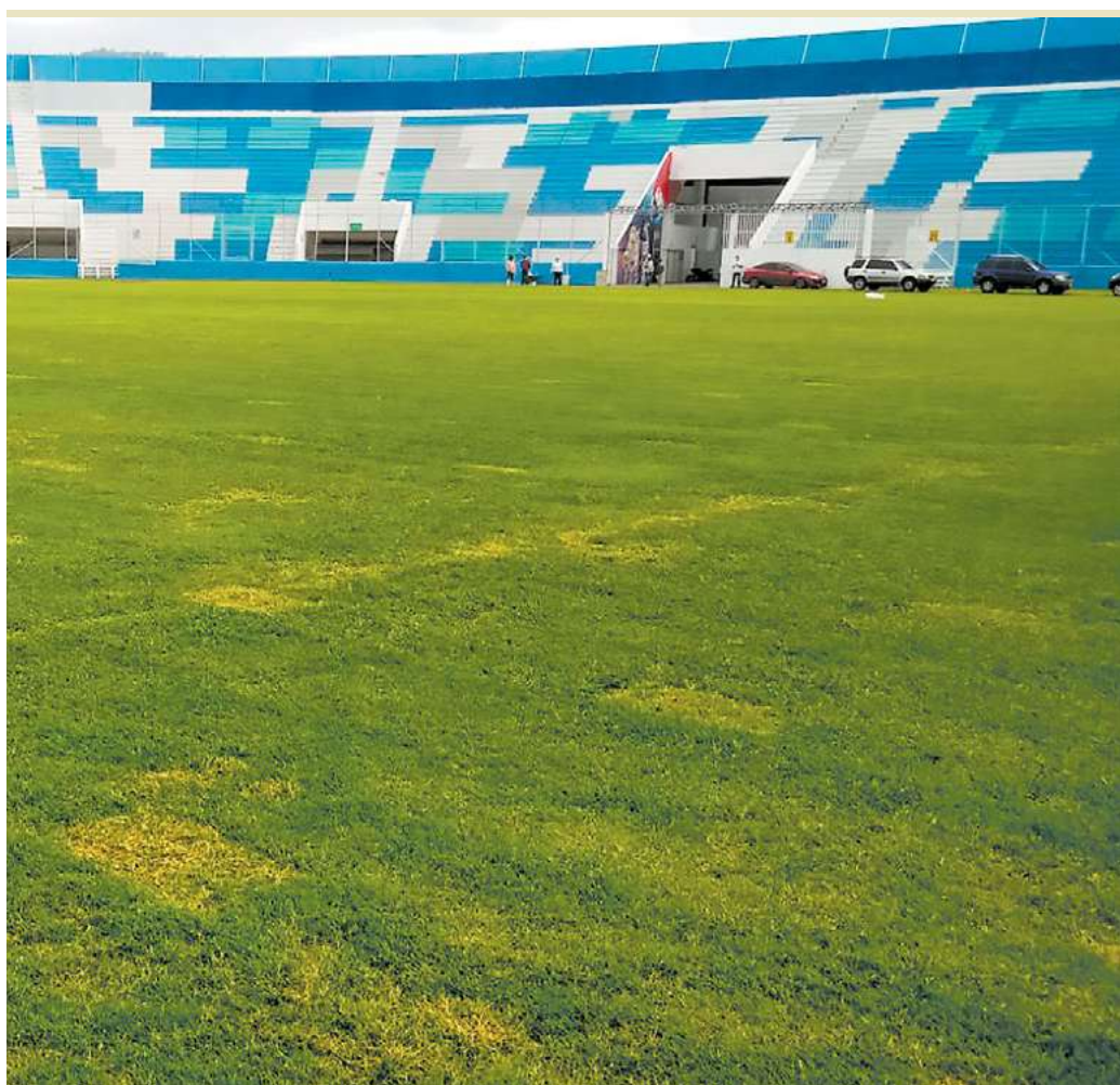
La obra ya comenzó a realizarse a un costo de 32 millones de lempiras, pero aseguran será un estadio del Siglo XXI.

A un costo de 32 millones de lempiras, además del cambio de engramado, se retocarán los servicios sanitarios en todos los sectores del estadio capitalino