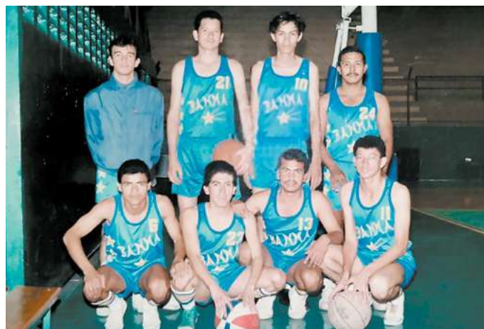
Además de judo, practicó varios deportes entre ellos, fútbol, kung fu y baloncesto.

No, lamentablemente no pude participar, porque cometí un error