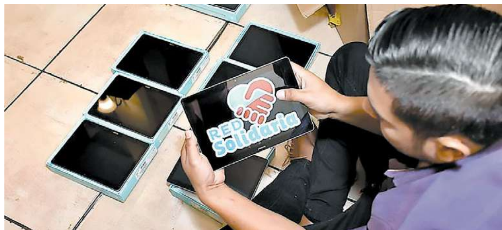
La Presidenta Xiomara Castro impulsa el Programa de la Red Solidaria que fue exitoso en la administración del expresidente, Manuel Zelaya (2006-2009).

El Programa de Gobierno busca el bienestar y desarrollo de las familias y desde luego enfoca las causas y raíces que provocan la pobreza, cómo disminuir la pobreza generando activos, reducir las brechas de desigualdad entre pobres y ricos por medio de oportunidades para los pobres. También coordina y ejecuta programas diseñados por SEDESOL, ya que este ejecuta las políticas y programas del Estado, pero sin nexos económicos o de autonomía.