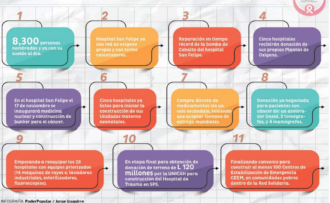
INFOGRAFÍA: PoderPopular / Jorge Izaguirre