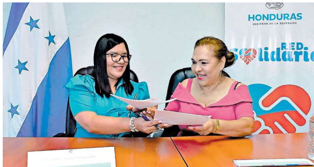
La Red Solidaria y Banasupro firmaron un convenio para la compra de productos que contendrán las Cajas de la Solidaridad con las cuales se atenderá la emergencia alimentaria en familias con extrema pobreza.

La funcionaria reveló que “la estrategia de intervención del