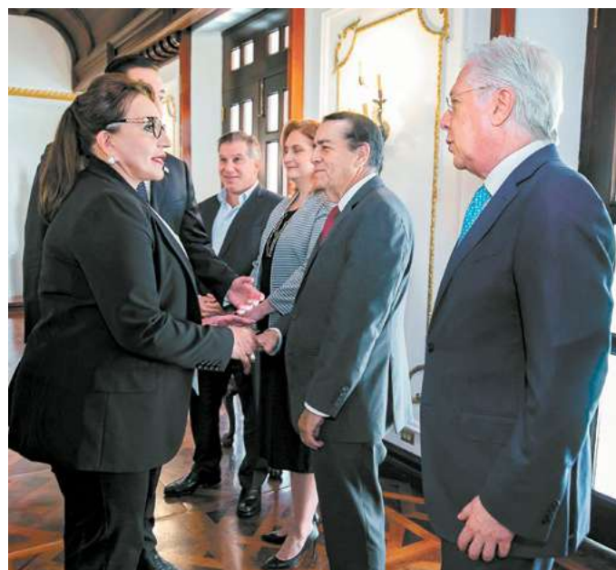
La Presidenta Xiomara Castro saludó a los miembros que conforman la Asociación Hondureña de Instituciones Bancaria (AHIBA).

Asimismo, asistieron los miembros del Consejo Hondureño de la Empresa Privada (COHEP) por ser los que proporcionan las condiciones macroeconómicas legales e institucionales para fomentar la riqueza y el desarrollo socioeconómico de Honduras. Estuvieron presentes en el en-