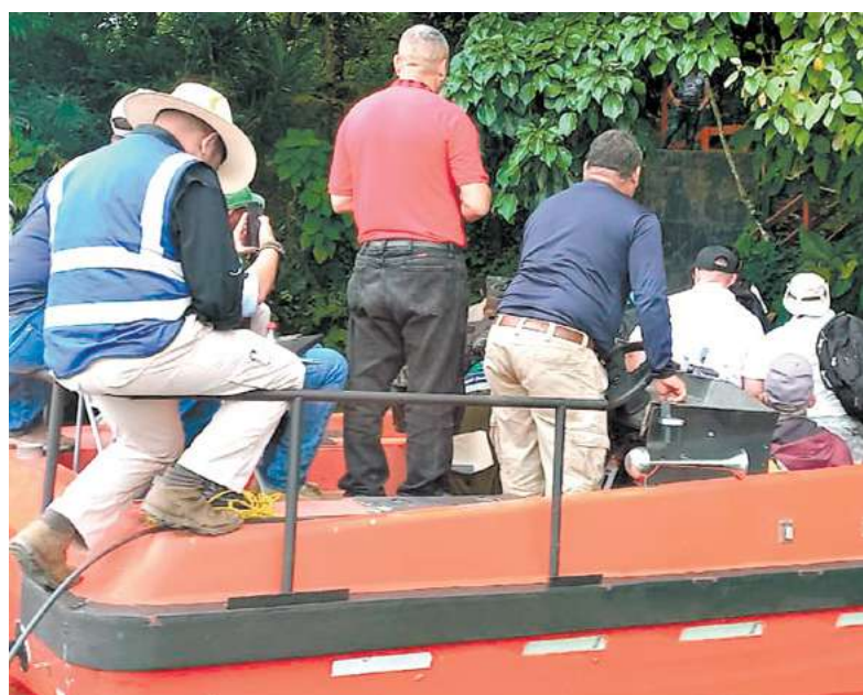
El equipo técnico interinstitucional ya realiza las diversas labores en toda la zona del Lago de Yojoa.