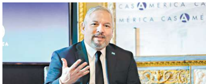
El Canciller Eduardo Enrique Reina dijo que las expresiones de Laura Dogu sobre Honduras complican las relaciones con el país.

en algunos twists es compleja; hemos expresado a los EE UU el escenario que vive el país con una situación financiera desastrosa, una institucionalidad y un Estado de derecho que no funcionan y la economía destruida y eso es lo terrible para la inversión”, sostuvo. “Un país donde los temas de energía eléctrica nos hacen ser no competitivos en Centroamérica porque es la más cara de la región; o de que se nos ha acusado de querer expropiar cuando no es cierto pues se ha negociado con 16 empresas eléctricas para sanear al sector eléctrico y las finanzas del país”.