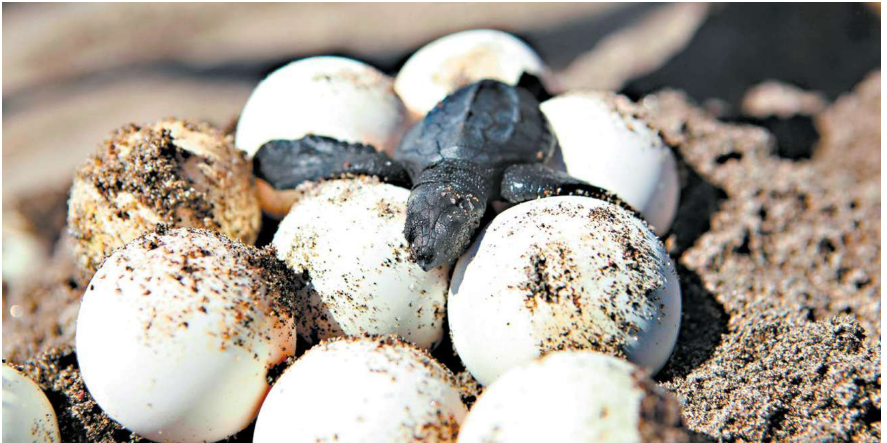
La pequeña especie sale por encima de los huevos para hacer su primera aventura al aire libre.