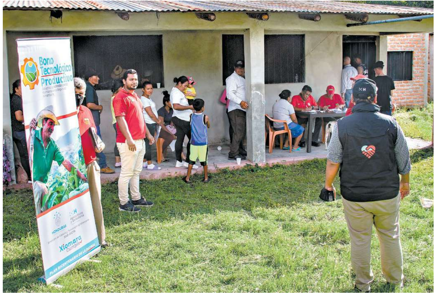
Los gestores de la Red Solidaria han estado ayudando en la entrega del Bono Tecnológico en diferentes lugares del territorio hondureño.

funcionaria aseveró que “se usará la gran estrategia de alfabetización escolar para el millón de personas que están en analfabetismo”. Figuroa explicó como algunos centros educativos seleccionados recibirán computadoras, y a la vez explicó que “vamos a extender a tercer ciclo las escuelas que llegan hasta sexto grado, estas son las que están en el marco de la Red Solidaria, la idea es que luego a través del IHER o Educatodos, se ofrezca el bachillerato”. “En Infraestructura estamos trabajando en mejoras en vivienda, agua y saneamiento, el bosque y las microcuencas de agua, así como en la construcción y reconstrucción de centros de salud y educativos”, explicó la ministra.