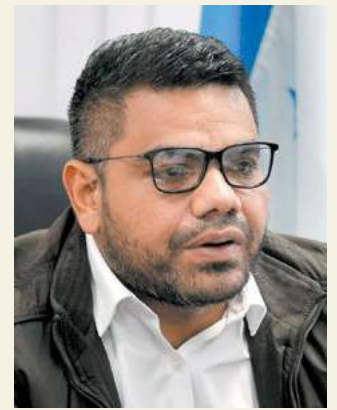
Luis Solís, ministro de ICF, anunció que reforestación de las cuencas aledañas al Lago de Yojoa.

El titular del Instituto de Conservación Forestal (ICF), Luis Solís, informó que como parte del rescate del Lago de Yojoa van a reforestar las cuencas de todo ese ecosistema. “Con el Programa Andrés Bello y otros comanejadores de áreas protegidas, vamos a reforestar las nueve cuencas hidrográficas del Lago de Yojoa, porque si protegemos las cuencas, protegemos el Lago, además el hábitat para la flora y fauna”, afirmó Solís. Agregó que el mejor embalse que tenemos son los bosques y si estamos perdiendo cobertura forestal, eso se verá reflejado en el ecosistema. Otro de los problemas que han detectado es que la debilidad boscosa provoca que las lluvias en manera de corrientes lleguen al Lago con contaminantes de las zonas aledañas. El funcionario afirmó que “lo que sí tenemos claro es que