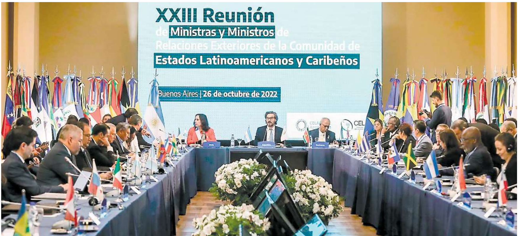
Honduras estuvo representada en la XXIII Cumbre de la CELAC en Buenos Aires, Argentina, por el Secretario de Relaciones Exteriores, Eduardo Enrique Reina.