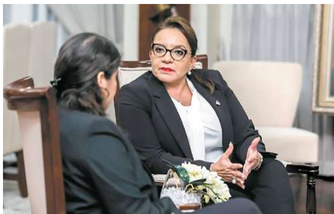
La Presidenta Xiomara Castro expuso a la representante de WOLA las condiciones en que recibió el país producto de la dictadura y las políticas que impulsa en favor de los Derechos Humanos.

En cuanto a género, la Presidenta de la República destacó que en relación al 2021, los femicidios han descendido