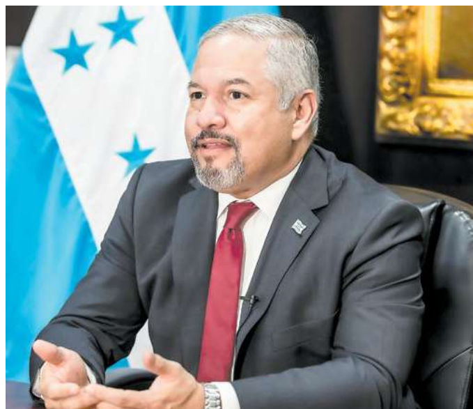
El Canciller Eduardo Enrique Reina está comprometido con los hondureños por medio del Gobierno Solidario para favorecer a los compatriotas en el extranjero.

1. Expresamos nuestra solidaridad con los más de 337 mil migrantes de El Salvador, Nicaragua y Nepal, dentro de los cuales se encuentran, de manera especial, cerca de 58 mil hondureños beneficiarios del Estatus de Protección Temporal (TPS), que residen actualmente en los Estados Unidos de América, al