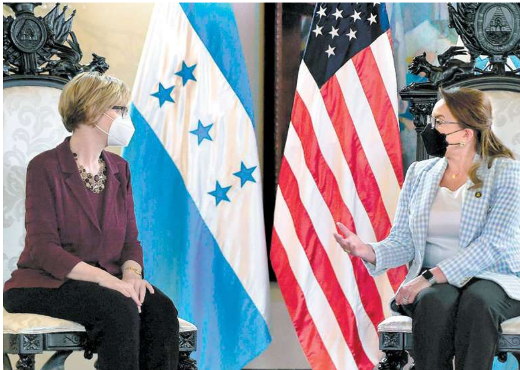
La Embajadora de Estados Unidos, Laura Dogu durante uno de varios encuentros que ha sostenido con la Presidenta Xiomara Castro.