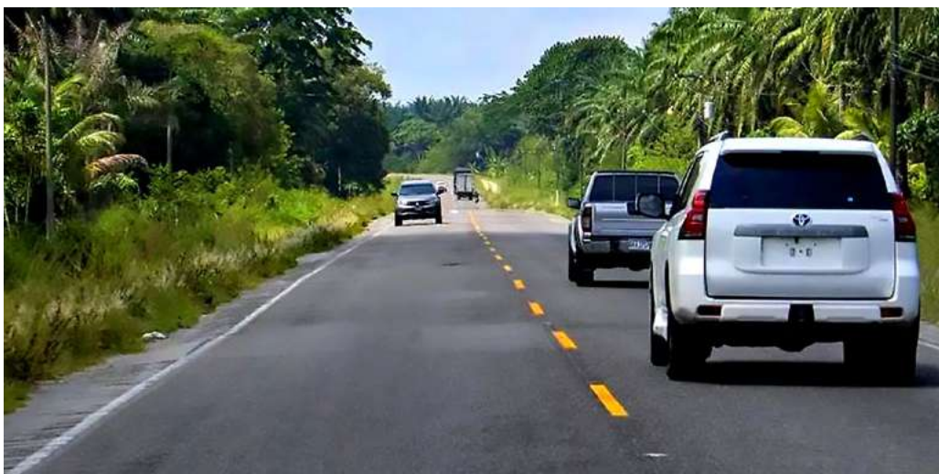
La construcción de los nuevos carriles de El Progreso - Tela será muy parecida a la CA-5, y también se construirán o renovarán nuevos puentes.