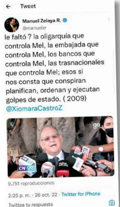
El expresidente Zelaya identificó a los sectores que planifican, ordenan y ejecutan golpes de Estado en Honduras.