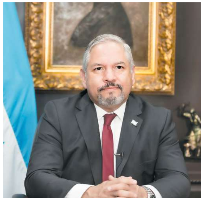
El Canciller, Eduardo Enrique Reina, representó a Honduras en el encuentro de la CELAC.

En el foro de la CEPAL el canciller Eduardo Enrique Reina, expuso que Centroamérica y el Caribe "somos los que menos daño ocasionamos al planeta, en términos de vulnerabilidad climática, pero