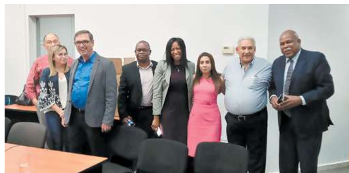
Miembros de la sociedad civil, de la plataforma nacional PLANAPONH, llegaron a la sede de la Junta Nominadora a manifestar su respaldo al trabajo que realizan por una nueva CSJ.