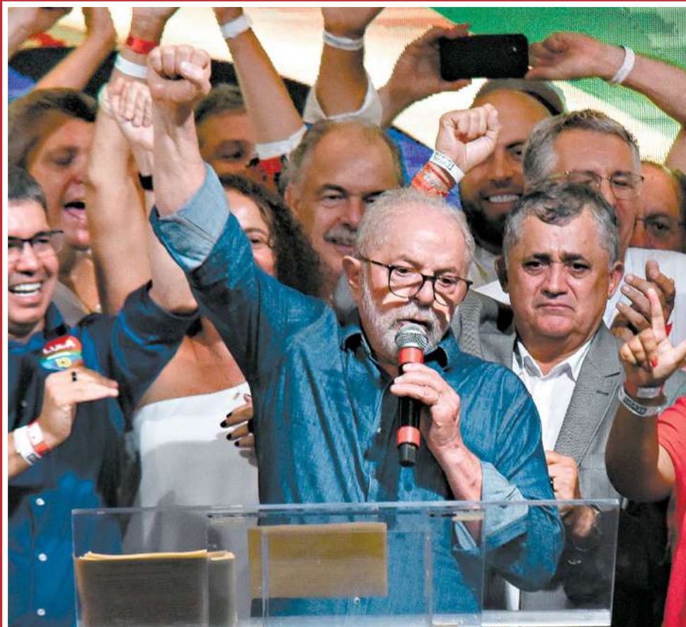
Luiz Inácio Lula da Silva fue declarado ganador de la segunda vuelta de las elecciones presidencial de Brasil, en un hecho histórico en la política de América Latina.

la Amazonia de la deforestación. “Estoy aquí para gobernar este país en una situación muy difícil, pero con la ayuda del pueblo vamos a encontrar una salida