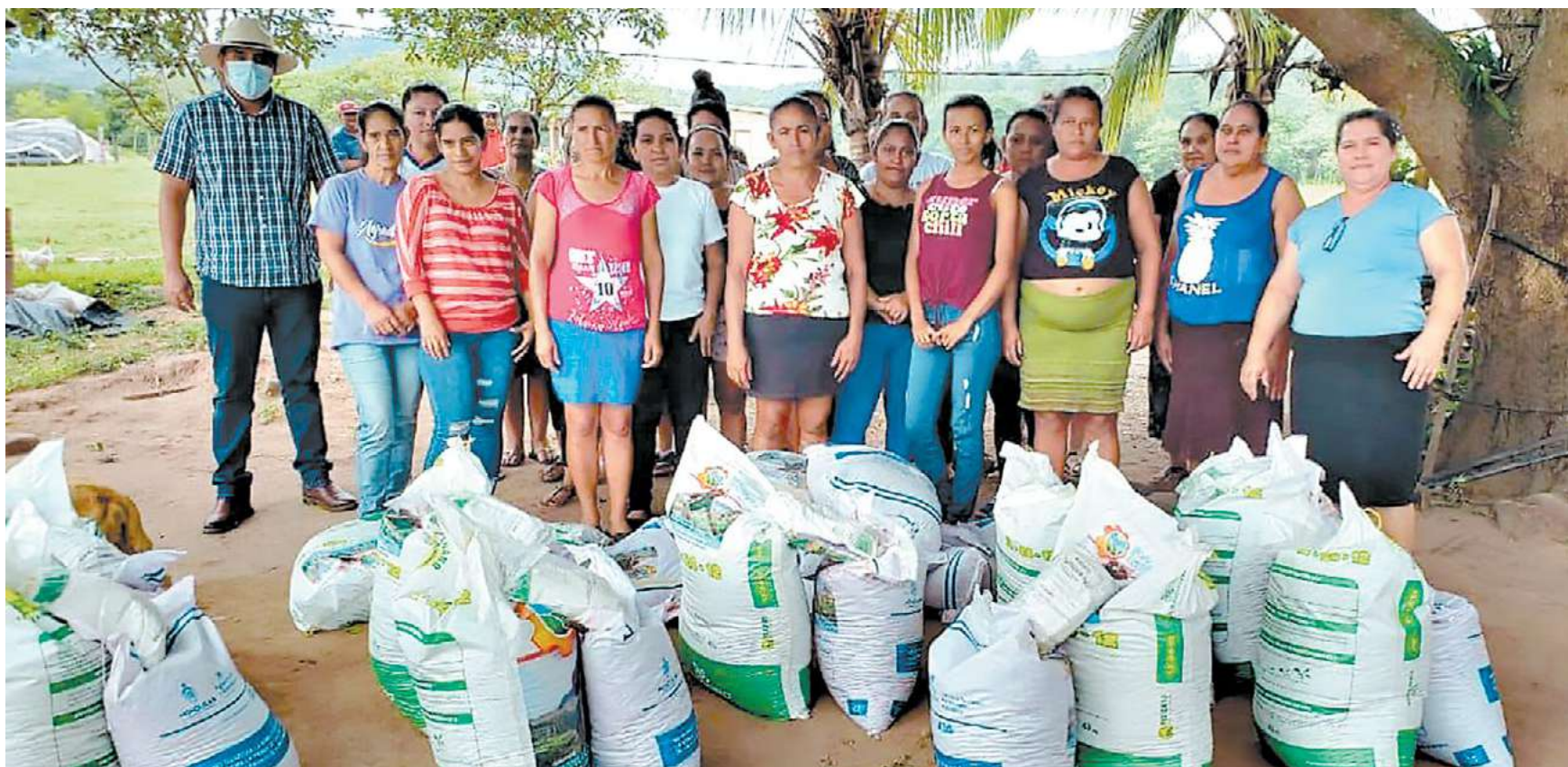
El 45 por ciento de los beneficiarios con el Bono Tecnológico son mujeres campesinas que están organizadas en cooperativas a nivel nacional.