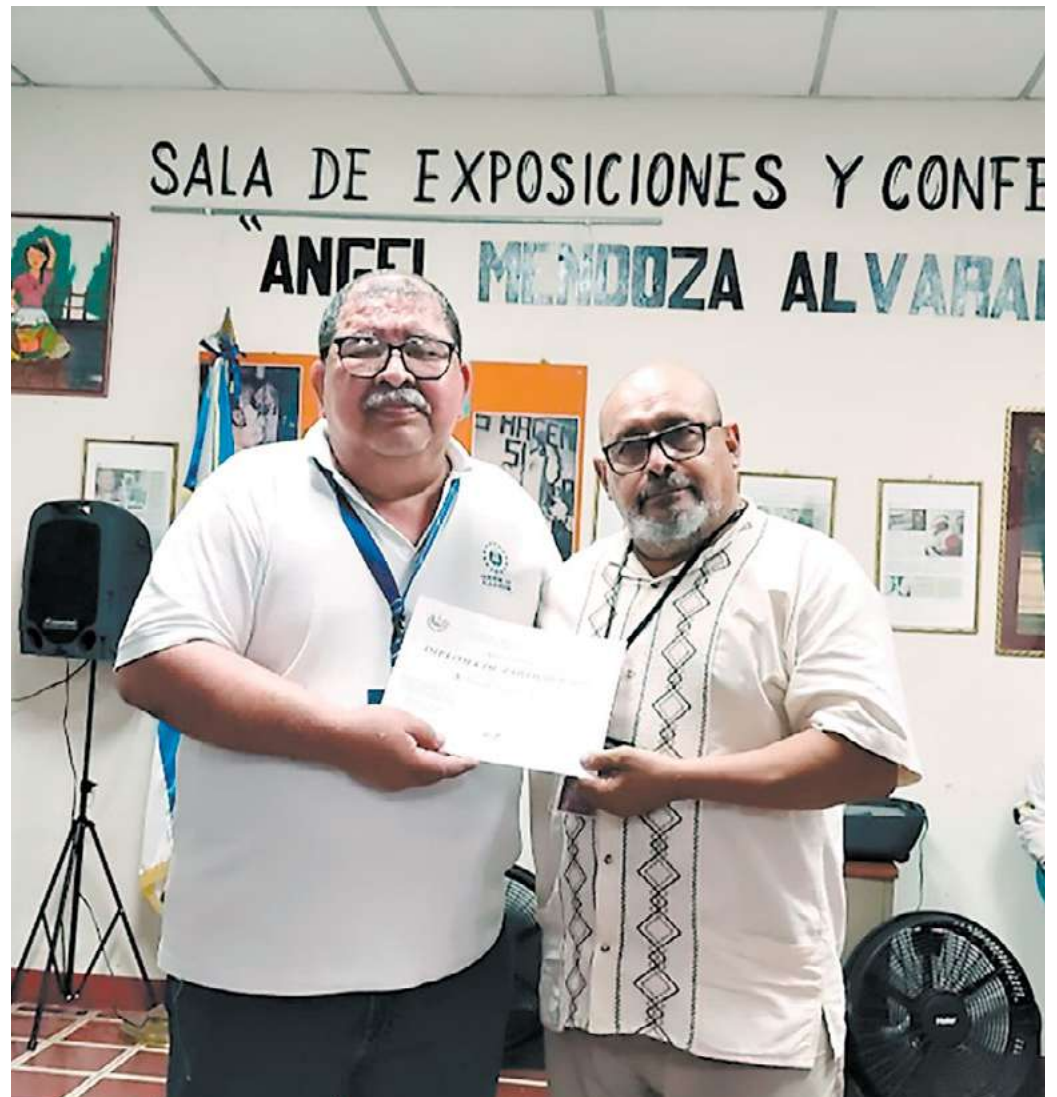
Casa de la Cultura, San Rafael Obrajuelo, El Salvador 2022