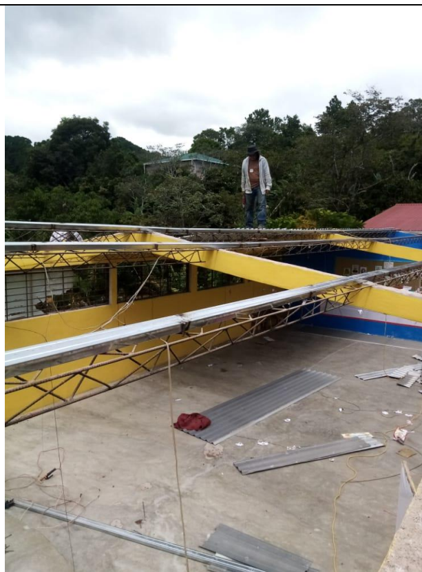
Instalación de canaleta para reforzar la estructura.