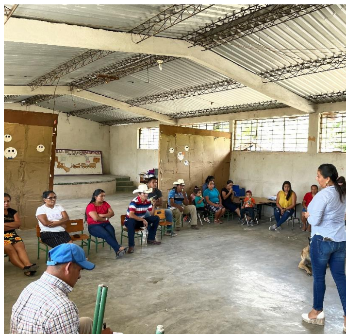
Programacion de actividades, padres y maestra del Jardin de niños.

INFORME MENSUAL DE PROYECTO EN EJECUCION PRERIODO ENTRE EL 01-31 DE OCTUBRE DE 2022.