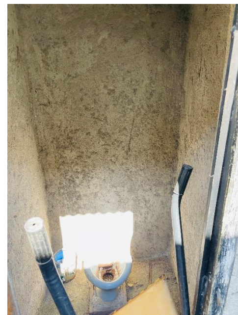
Modulo de sanitarios en mal estado.