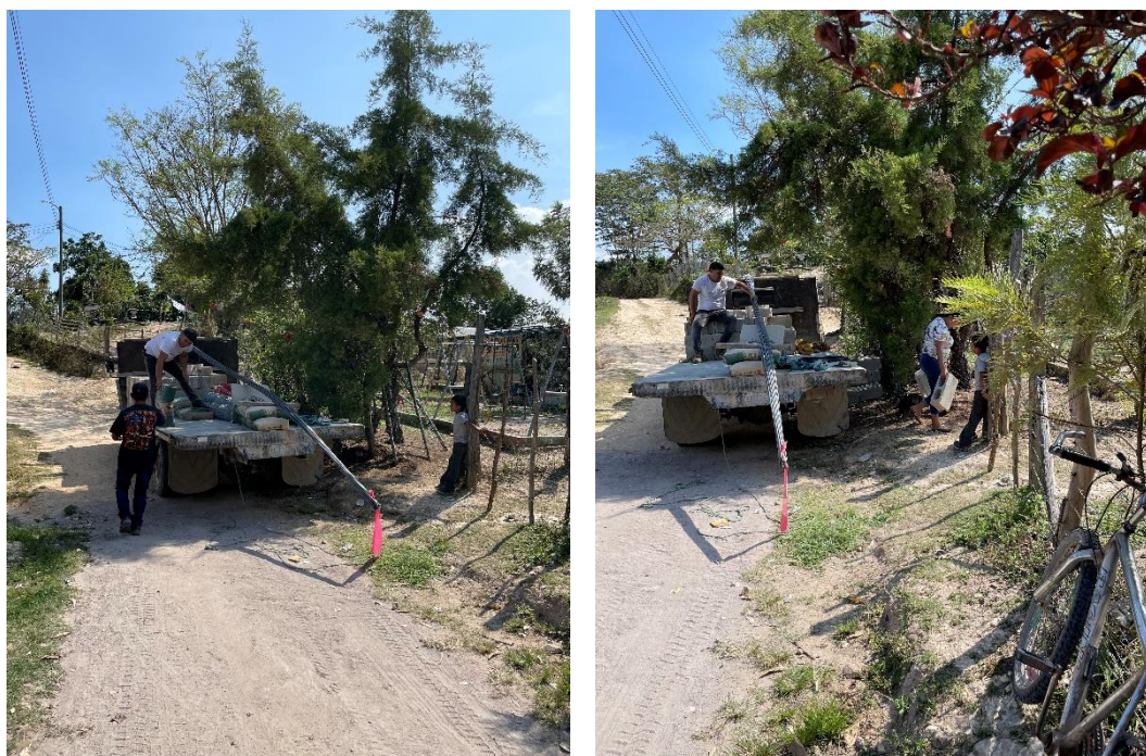
Acarreo de materiales, arena, piedra, bloque y cemento.

INFORME MENSUAL DE PROYECTO EN EJECUCION PRERIODO ENTRE EL 01-31 DE OCTUBRE DE 2022.