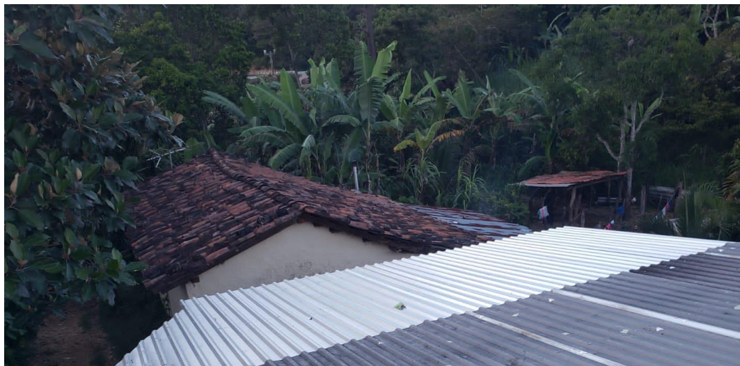
Instalación de techo, Modulo de baños.