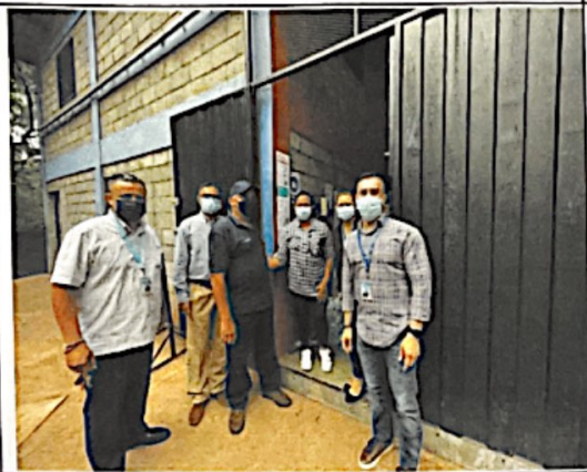
"Recolección de víveres para donar a las familias que fueron afectadas por los deslizamientos en la colonia Guillen"