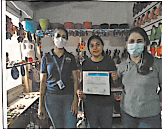
"Procesos de Formalización de Microempresas Bajo en Sector Social de la Economía"