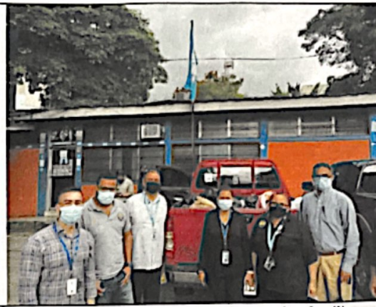
"Recolección de víveres para donar a las familias que fueron afectadas por los deslizamientos en la colonia Guillen"