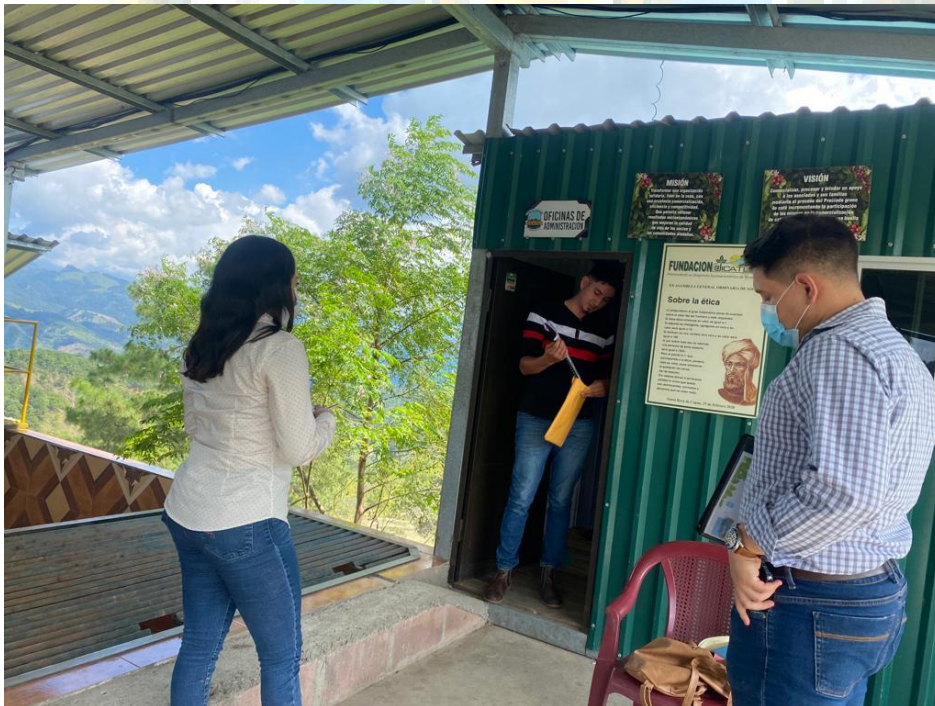
Empresa Sesecapa Energy Company S.A.

Cooperativa Cafetera Tecomapa Limitada COCATEL