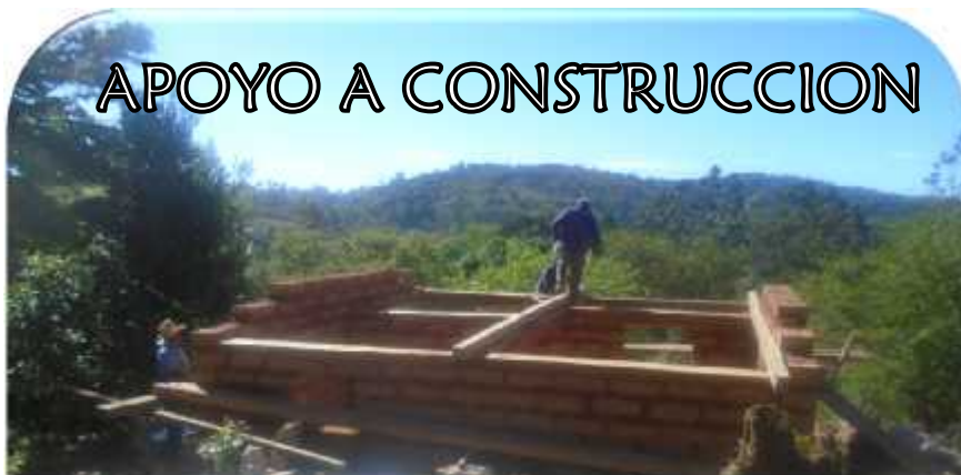
APOYO A CONSTRUCCION