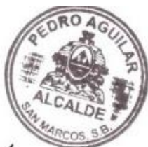
Pedro Armando Aguilar Orellana Alcalde Municipal