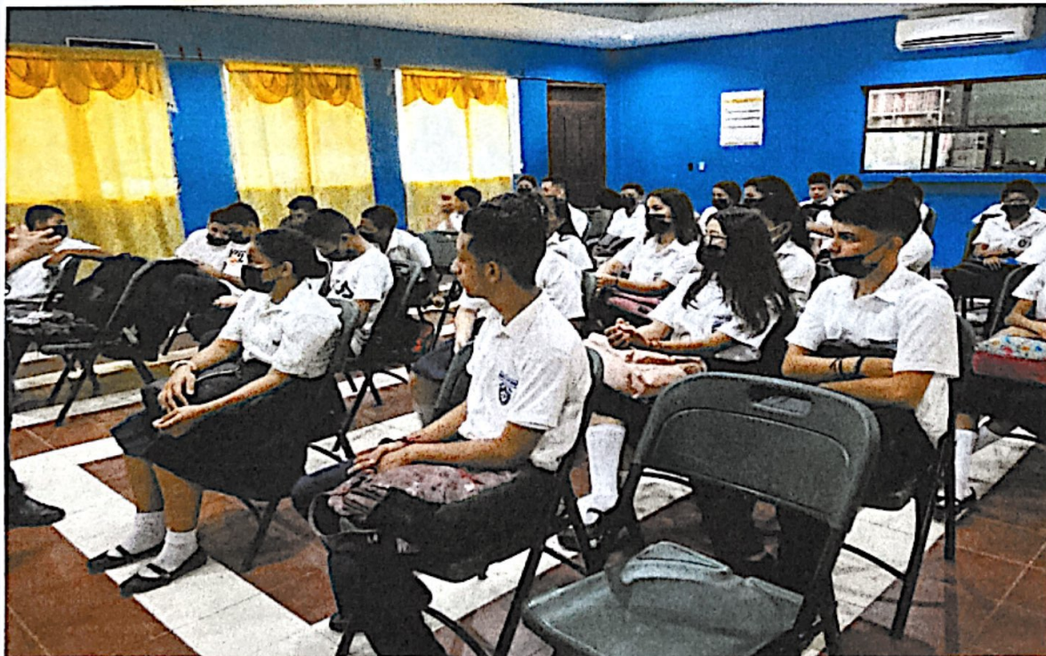
Trabajando por la unidad y desarrollo de las comunidades.