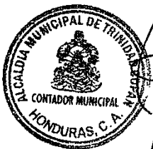
[Signature] Contador Municipal