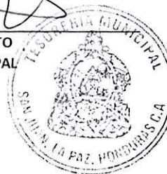
DIEGO RAMON SOTO TESORERO MUNICIPAL