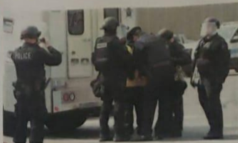
Desde que llegó la pandemia de COVID-19 Estados Unidos impuso medidas de restricción más severas para los migrantes.

Al público en general se informa que la sociedad mercantil Inversiones SJ, S.A. de C.V., en su condición de propietaria en dominio pleno de los bienes inmuebles ubicados en el municipio de Roatán, Islas de la Bahía, e inscritos bajo las matrículas número: 366019, 365863, 367828, 364989, 364978, 375017, 863885, 863700, 876611, 761696, 1018403, 601291, 601292, 601300, 601338, 601339, 802448, 802449, 802450, 802451, 802455, 802456, 802457, 802458, 802459, 802460, 802461, 802465, 802466, 802467, 802468, 802469, 802470, 802471, 802479, 802480, 802481, 802482, 802483, 802484, 802485, 802486, 802487, 802488, 802489, 802453, 601289, 601344, 601345, 601346, 601347, 601348, 601349, 709123 del sistema de folio real del Instituto de la Propiedad, circunscripción registral de Roatán, Islas de la Bahía, ha incorporado voluntariamente los antecitados inmuebles de baja densidad poblacional al régimen especial contemplado en los artículos 294, 303 y 329 de la Constitución de la República, de conformidad a los artículos 6, 26 y 39 del decreto legislativo no. 120-2013. Para más información llamar al +50496292372.