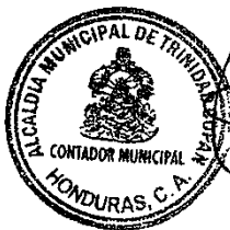
[Signature] Contador Municipal