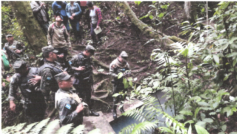
Ilustración 6 INSPECCION EN JUNTAS DE AGUA