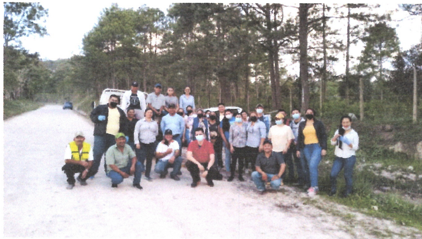
Ilustración 8 APOYO CAMPAÑA DE LIMPIEZA