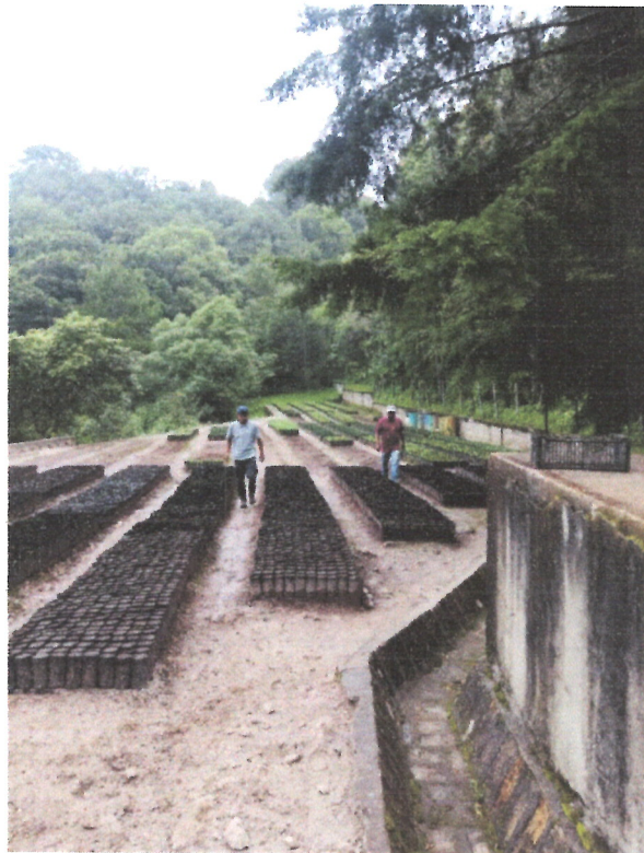
Ilustración 4 ENTREGA DE ARBOLES DONADOS POR DESTACAMENTO PALO BLANCO