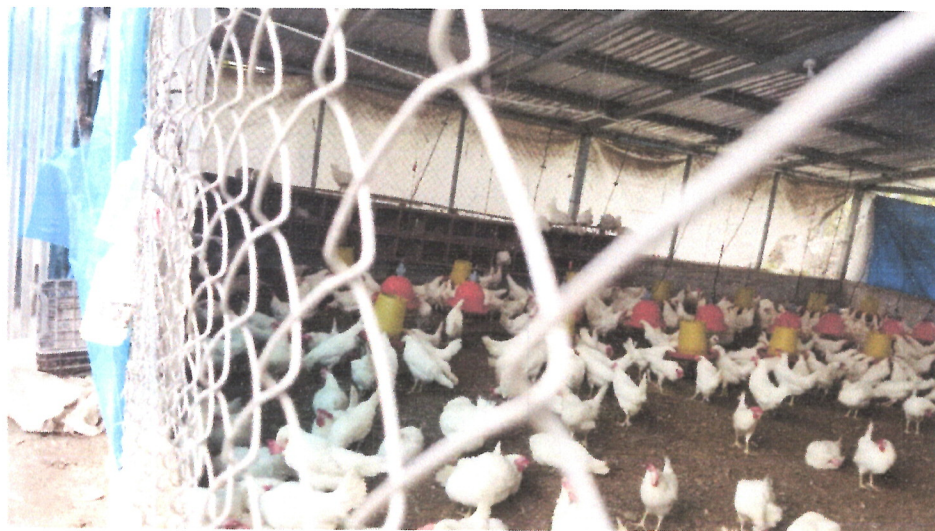
Ilustración 5 INSPECCION EN GRANJA AVICOLA