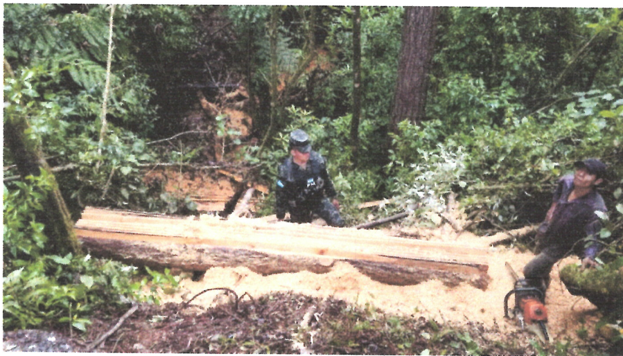
Ilustración 2 INSPECCIONES DE CORTA DE ARBOLES CON PERMISOS, Y TALA ILEGAL