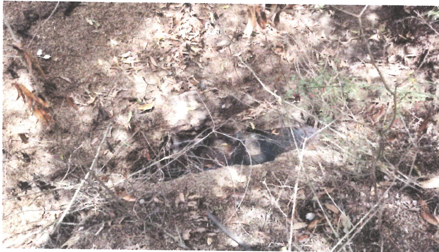
Ilustración 3 INSPECCION EN BENEFICIO CAFE DE MI TIERRA