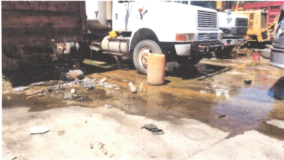
Ilustración 7 INSPECCION TERRENO ABEL BENITEZ