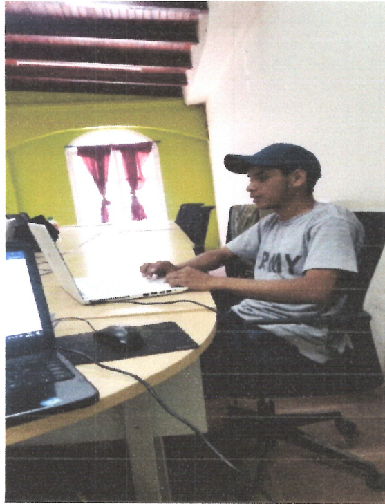
Ilustración 9 ELABORACION DE DICTAME TECNICO PRESENTADO A COORPORACION