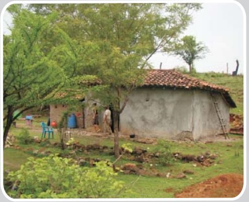
Las negociaciones se realizan con cada afectado aplicando las estrategias de socialización, comunicación y acompañamiento necesarias.

Goascorán, Valle. – Un total de 1036 casos han sido negociados y resueltos por INVEST – Honduras para liberar el derecho de vía en el Canal Seco hasta marzo de 2016, lo que ha permitido que las obras continúen sin atrasos.