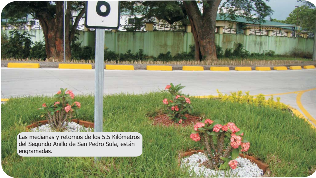
Las medianas y retornos de los 5.5 Kilómetros del Segundo Anillo de San Pedro Sula, están engramadas.

San Pedro Sula. - Con el objetivo de contribuir al ornato de la ciudad y en cumplimiento a los lineamientos ambientales del proyecto Segundo Anillo Vial de San Pedro Sula, se sembraron alrededor de cuatro mil plantas ornamentales, algunos arboles y grama especie San Agustín en medianas y retornos de la obra, así como vetiver para la estabilización de taludes del tramo intervenido.