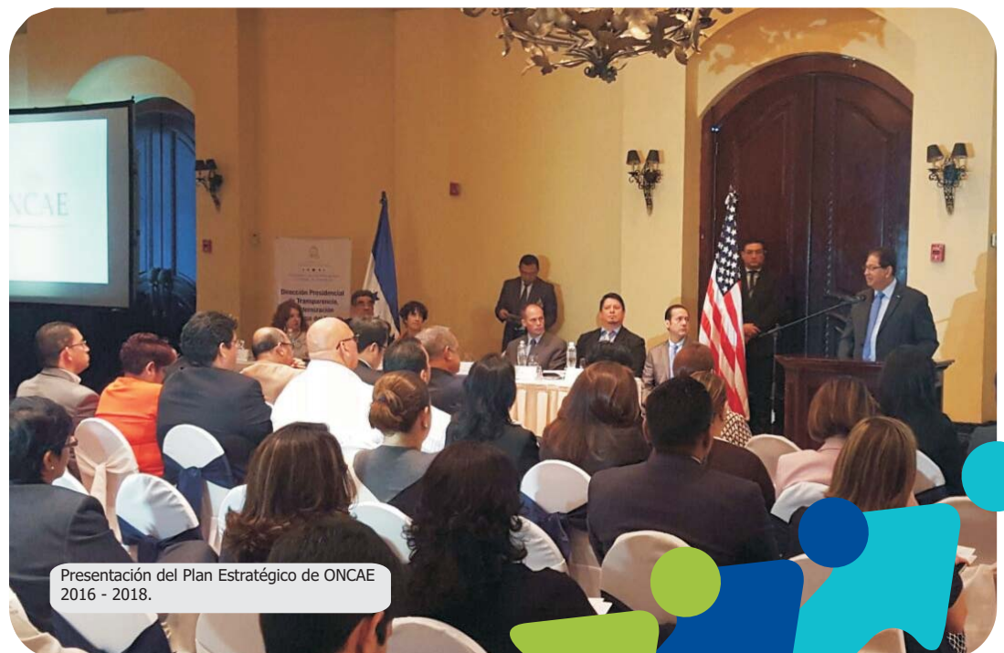
Presentación del Plan Estratégico de ONCAE 2016 - 2018.