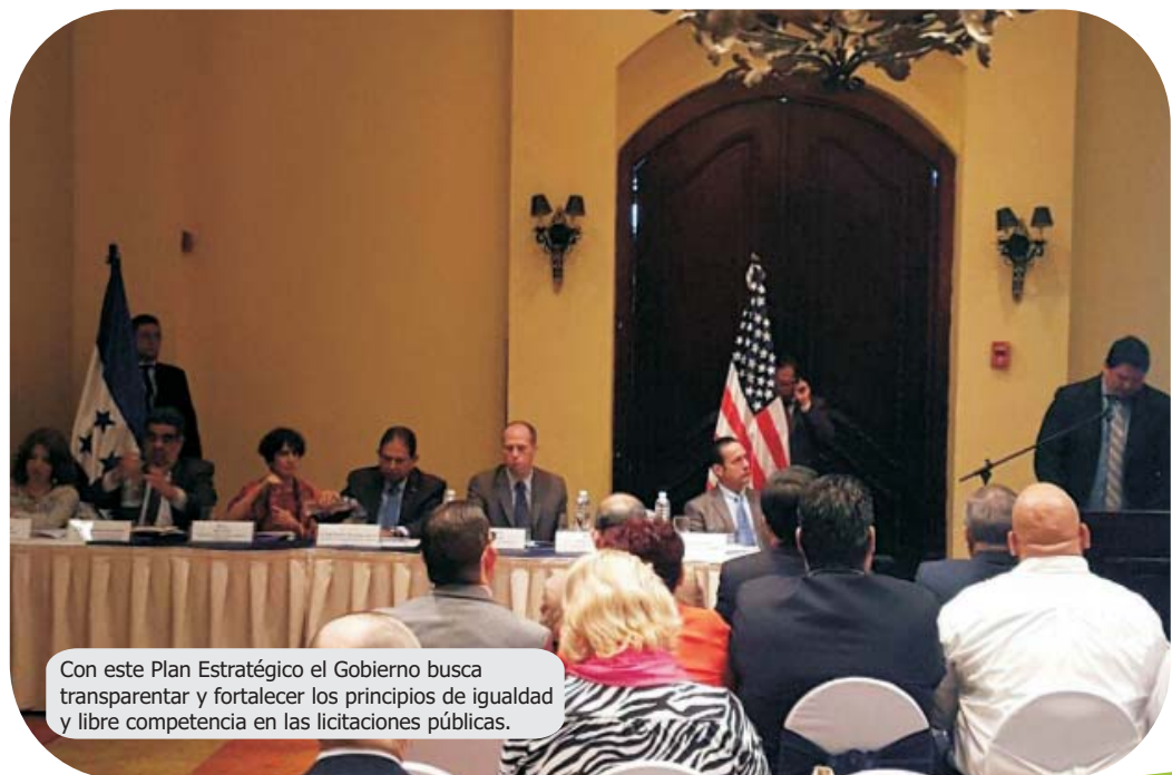
Con este Plan Estratégico el Gobierno busca transparentar y fortalecer los principios de igualdad y libre competencia en las licitaciones públicas.