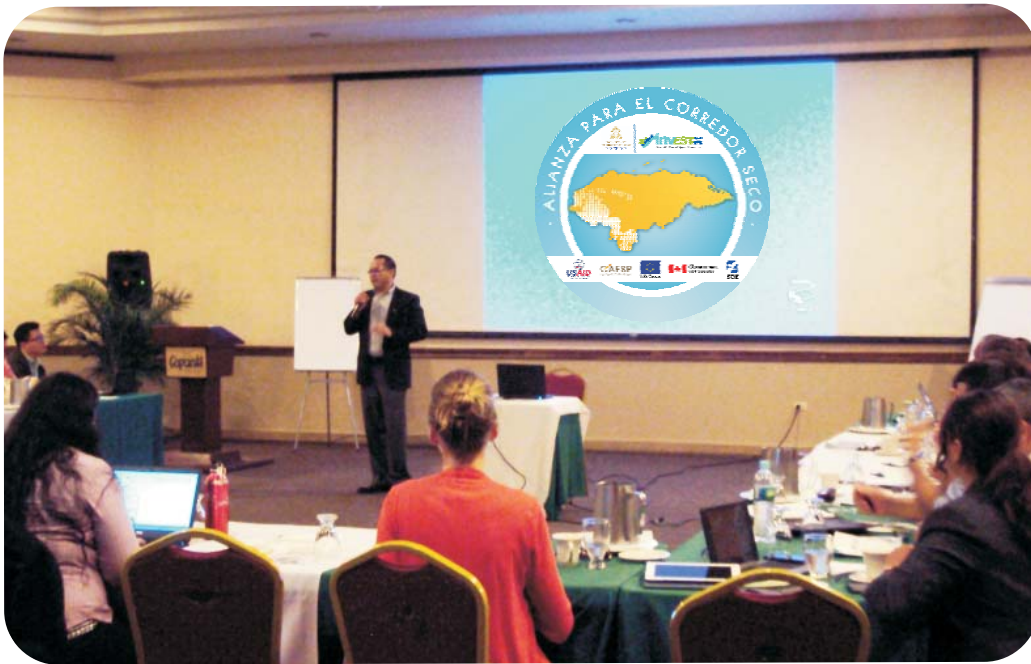
Técnicos de USAID, INVEST - Honduras y de la Secretaría de Salud (SESAL) durante el taller de coordinación.

San Pedro Sula, Cortés. - Con el objetivo de mejorar el estado nutricional de mujeres y niños en la zona de influencia de la Alianza para el Corredor Seco, se realizó un Taller de Coordinación entre técnicos de USAID, INVEST - Honduras y de la Secretaría de Salud (SESAL) para la discusión de las estrategias en campo y la elaboración de una ruta conjunta.