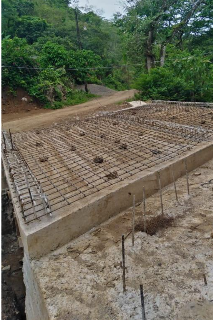
Inspeccion de caja puente Buenos Aires