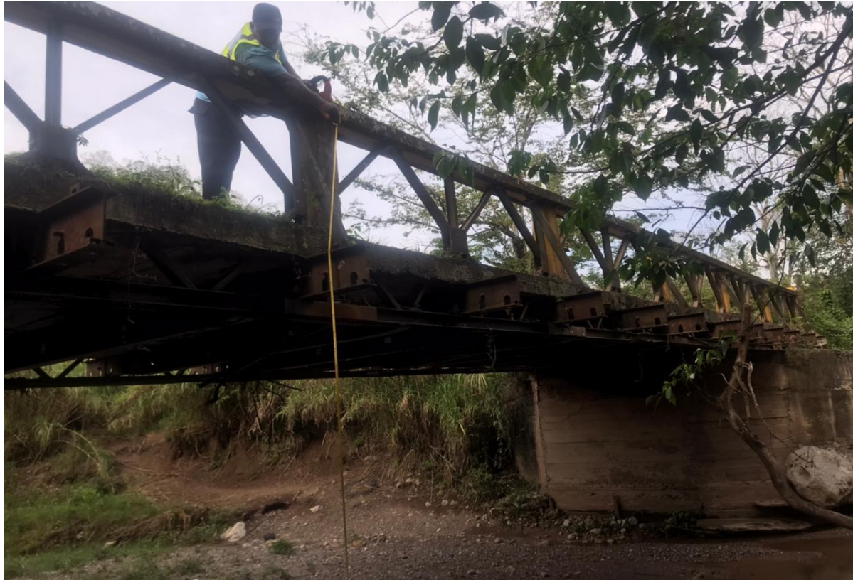
Inspecciones a puentes en las vegas 1er Equipo