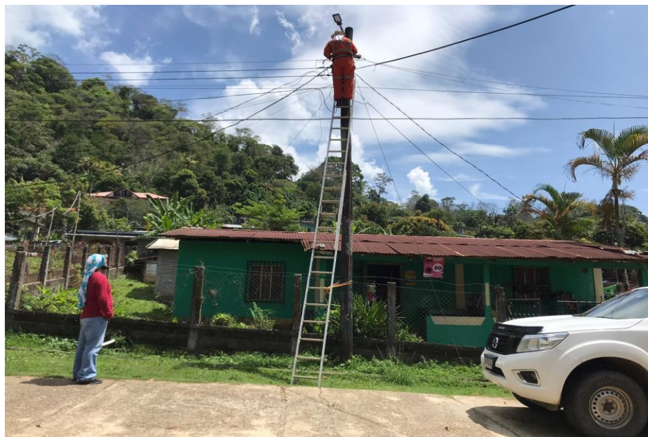
Instalacion de lamparas en Aldea Union Suyapa