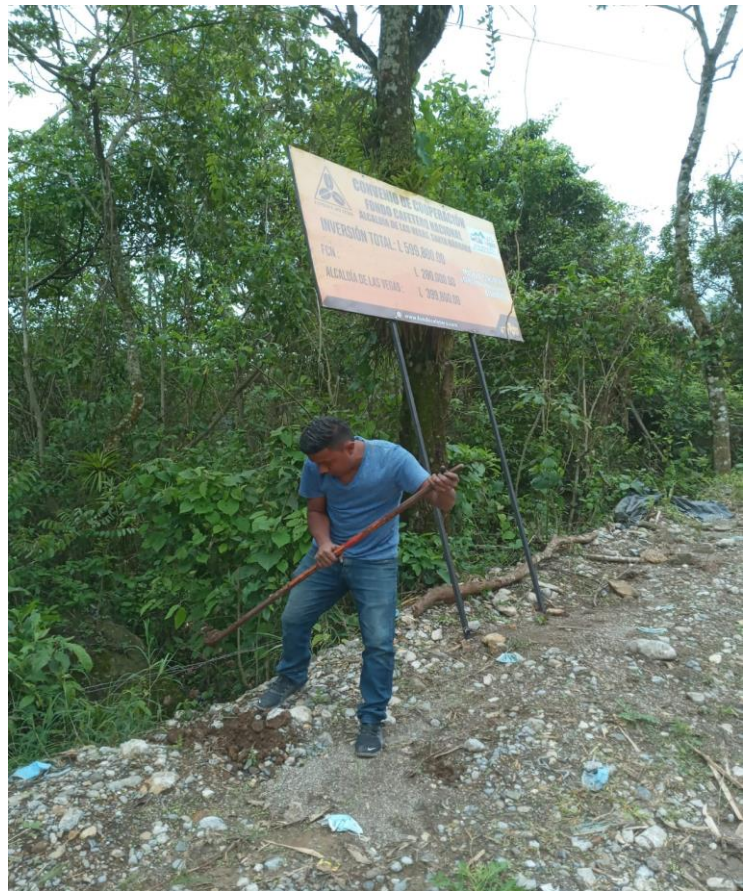
Movimiento de Rotulos