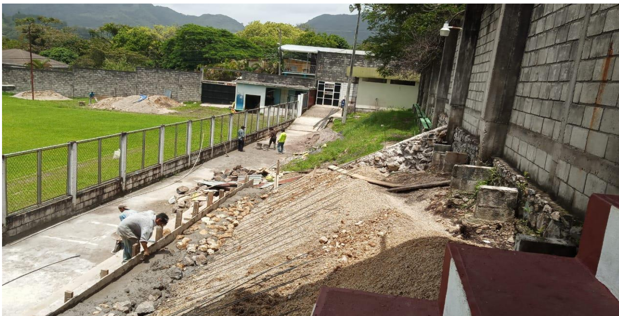
Supervision de avance de graderias en Estadio Municipal