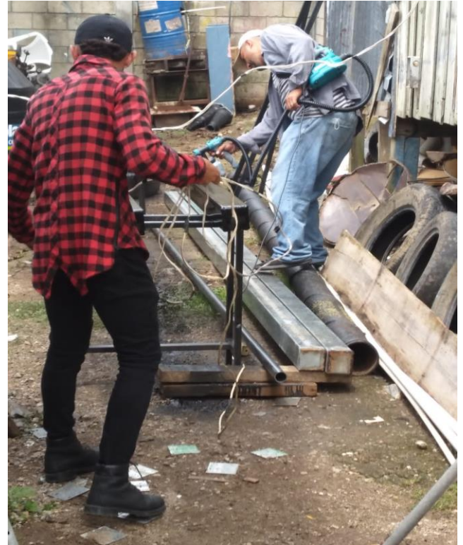
Instalacion de Focos, cableado y Pintura.