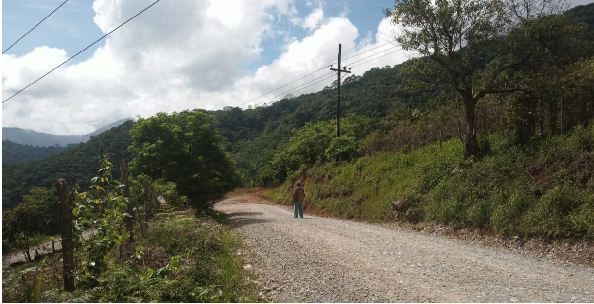
Medicion de Carretera que conduce hacia el carreto