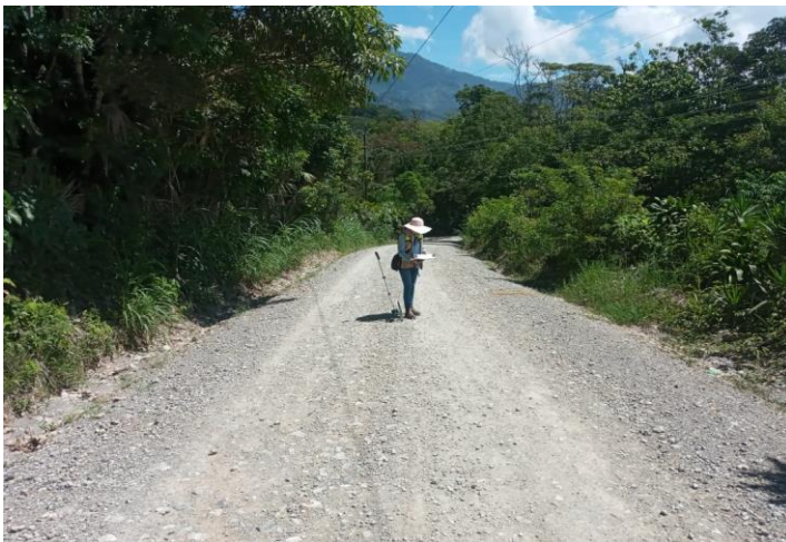
Medición para perfilado de proyecto pavimento El carreto-Mochito.