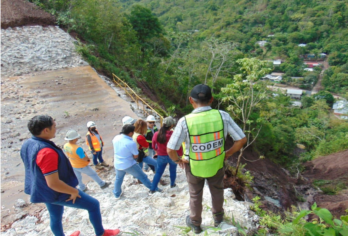
Inspección de derrumbe en zona Mina Ampac con Catastro / Justicia Municipal /Unidad Ambiental / Unidad Tecnica / CODEM.