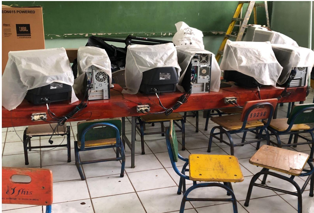
Supervision de Sala de Computo, revisión del circuito electrico Escuela Lesly.