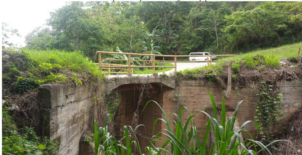
Inspecciones a Puentes 2do equipo y socavación.