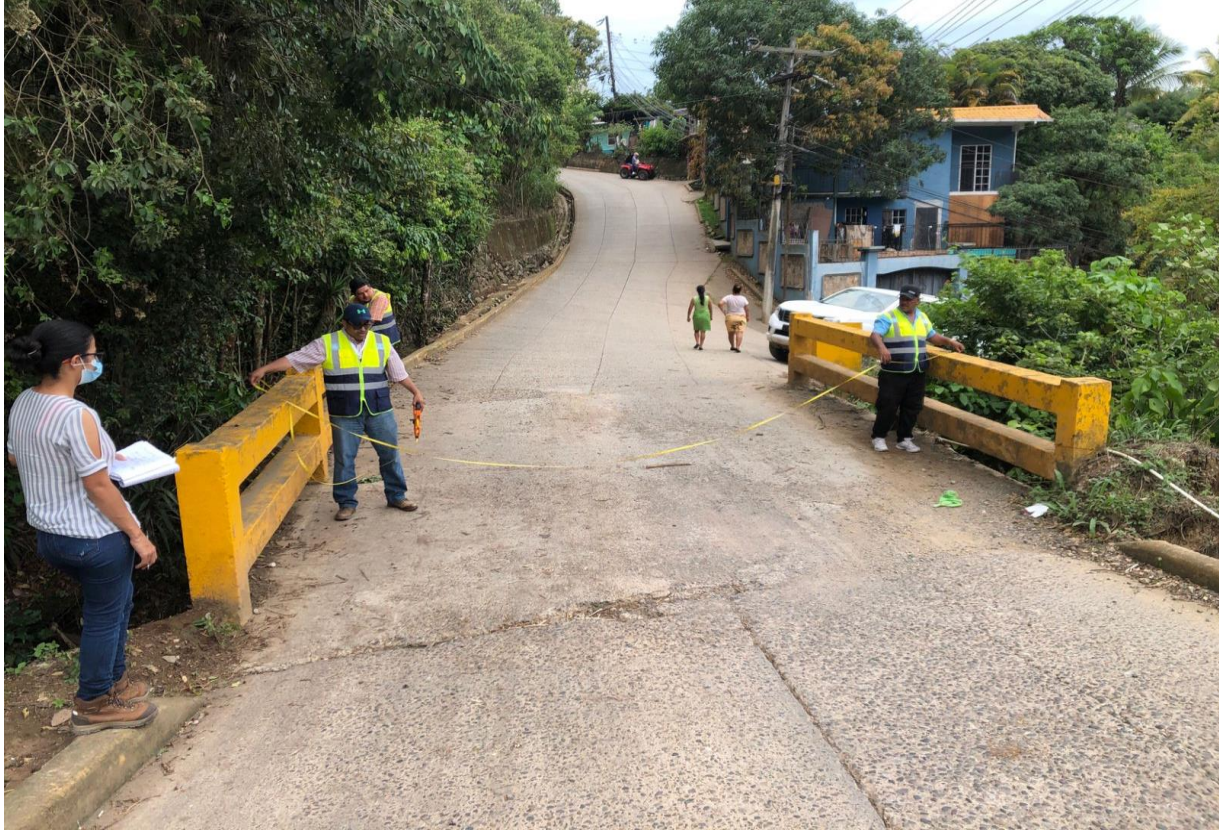
Inspeccion de Puente Lindo Barrio San Juan.