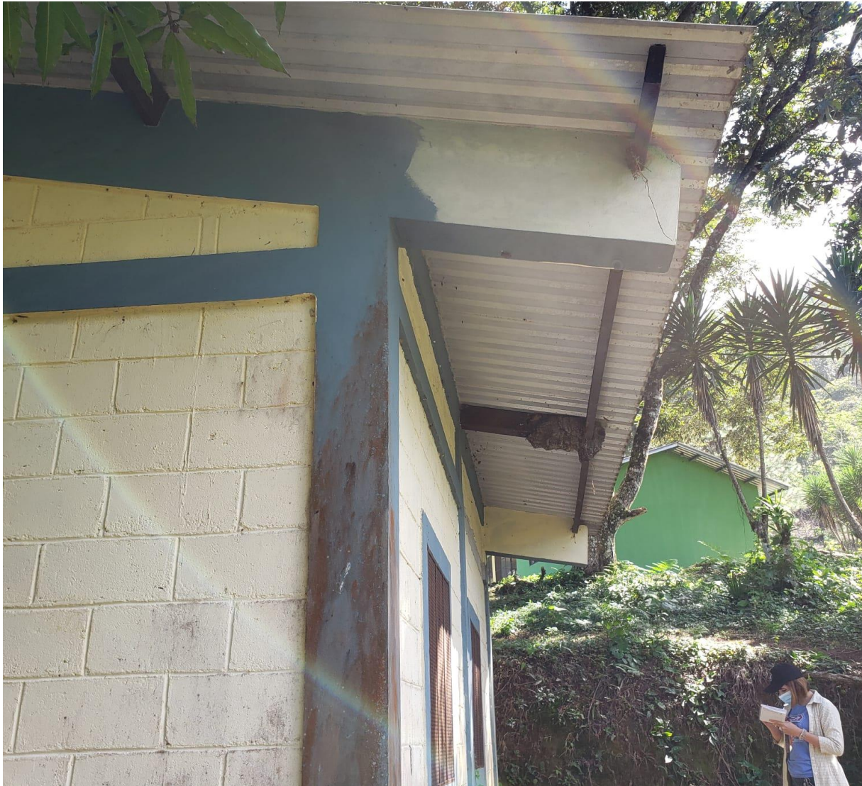
Inspeccion en techo en Escuela de Buenos Aires