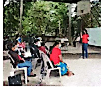
Ilustración 5 Foro con Mujeres, corporación municipal, juzgado de paz y otros invitados. Así mismo se organizó la Red Municipal de mujeres

Lugar y fecha: La Campa, Lempira, jueves 07 de julio del 2022