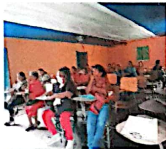
Ilustración 4 Organización de Red en Cañadas La Campa, Lempira