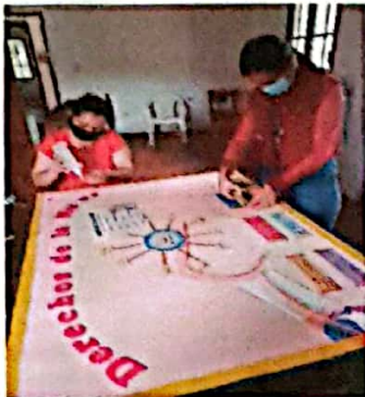
Ilustración 1 Elaboración de mural sobre Los Derechos de la Mujer y del informe mensual para hacer entrega a la oficina de Información Pública.