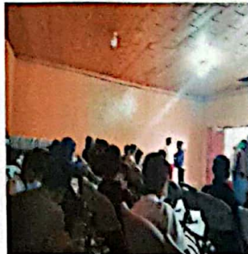
Ilustración 2 Acompañamiento en actividades de Junio Verde en el municipio de San Marcos Calquin