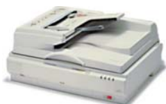
Escanner Bell & Howell