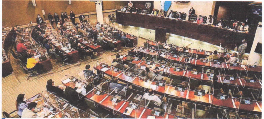
La bancada del PSH se opuso a que el préstamo se aprobara en un solo debate.