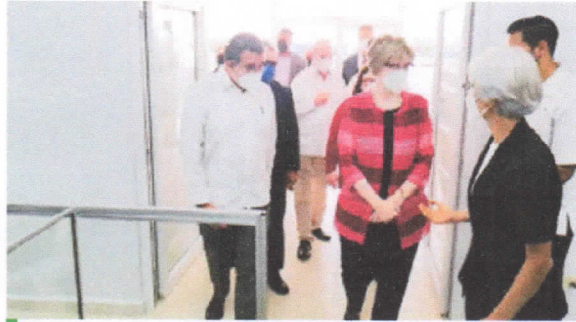
El Proyecto de rehabilitación CAMR-SPS fue ejecutado en un cien por ciento por la OIM.

Actualmente es administrado y operado por la Asociación Hermanas