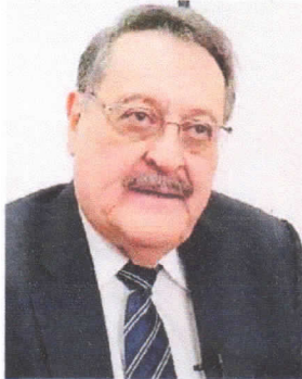
La iniciativa fue elaborada por la Secretaría de Transparencia que preside el ministro Edmundo Orellana.

La propuesta de Tomé, que ya tiene comisión de dictamen, busca que todo el proceso tradicional para elegir a magistrados de la CSJ, Fiscalía General y el mismo Tribunal Superior de