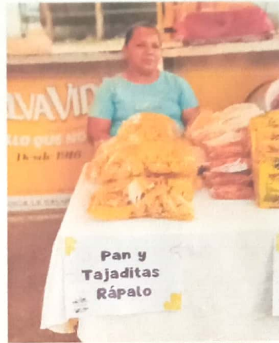
Pan y Tajaditas Rápalo