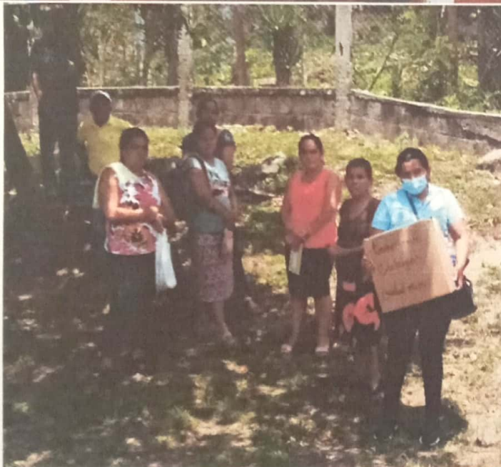
ENTREGANDO RESULTADOS DE CITOLOGIAS EN ALDEA EL VOLCAN