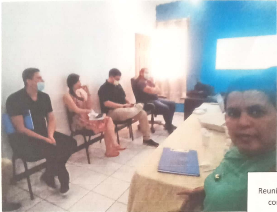
Reunión de SITAN con CODEM