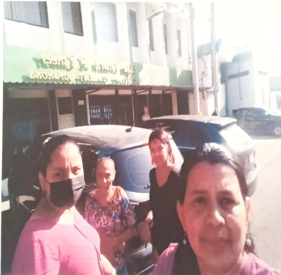
En la liga contra el Cáncer en seguimiento de resultados de citologías