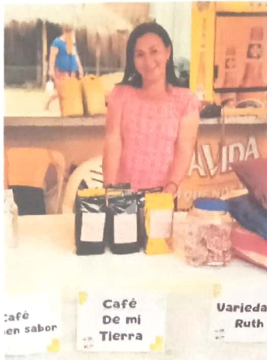
Café en sabor