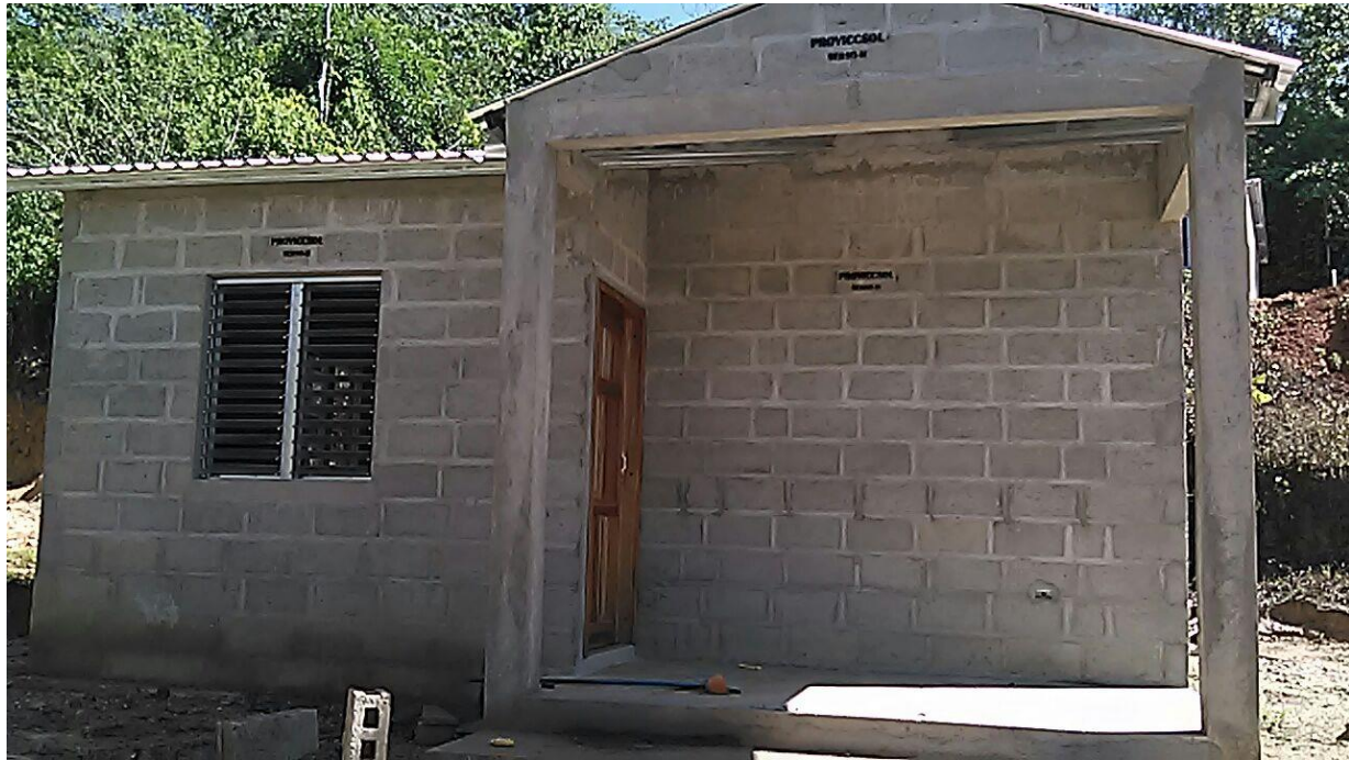
Vivienda Dispersa "SERSO IV" Jutiapa, Atlántida