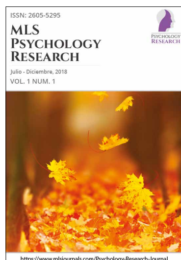
MLS Psychology Research