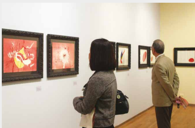
Inauguración exposición Miró: pintor, poeta . República Dominicana.

La labor, en estos años de andadura, ha sido ingente y continuará siéndolo en el futuro porque esa es nuestra ilusión y nuestro empeño.