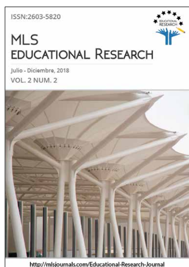
MLS Educational Research