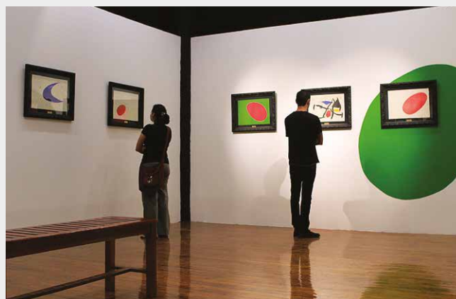
Exposición El cántico del sol y las maravillas acrósticas , Joan Miró. Honduras.