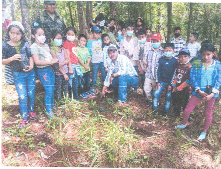
Ilustración 5 incorporación de las escuelas y alcalde municipal para la reforestación