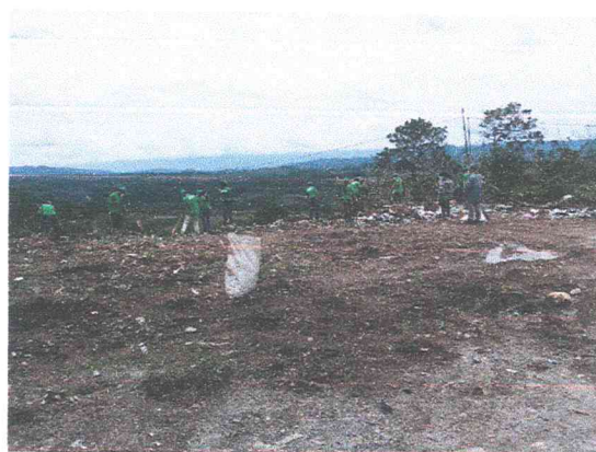
Ilustración 1 campaña de limpieza con jóvenes para la conservación