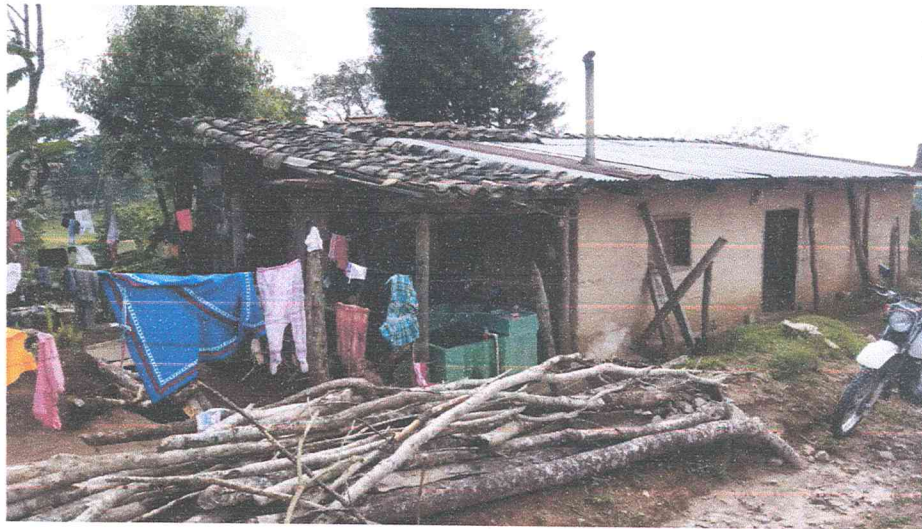
Ilustración 11 COMUNIDAD DEL BORBOLLON CASA DONDE SE UTILIZARÁN PERMISOS