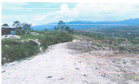
Ilustración 4 trabajo de la retro para mantener orden en el botadero