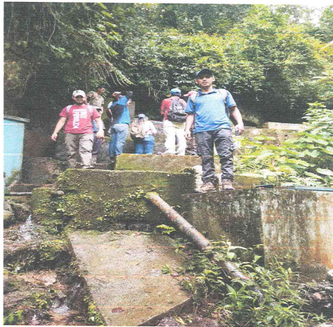
Ilustración 10 VICITA 7 CANALES