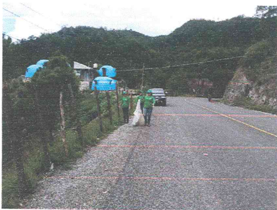
Ilustración 2 campaña de limpieza