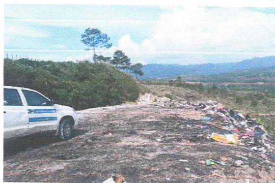
Ilustración 3 arrastre de la basura