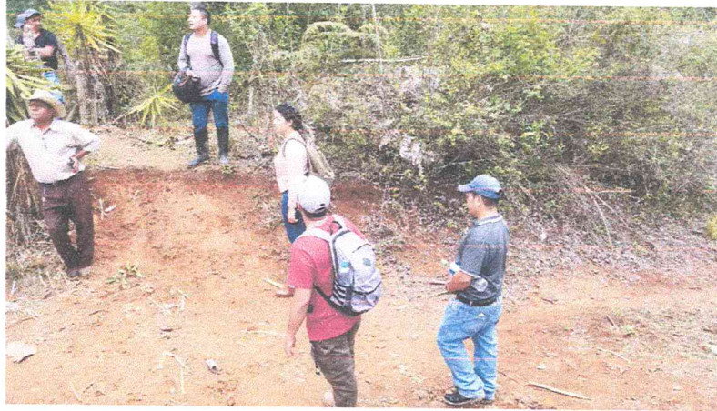
Ilustración 9 problemática en 7 canales UMA, JUSTICIA MUNICIPAL TAS