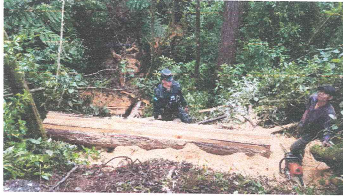
Ilustración 14 detenciones por tala ilegal