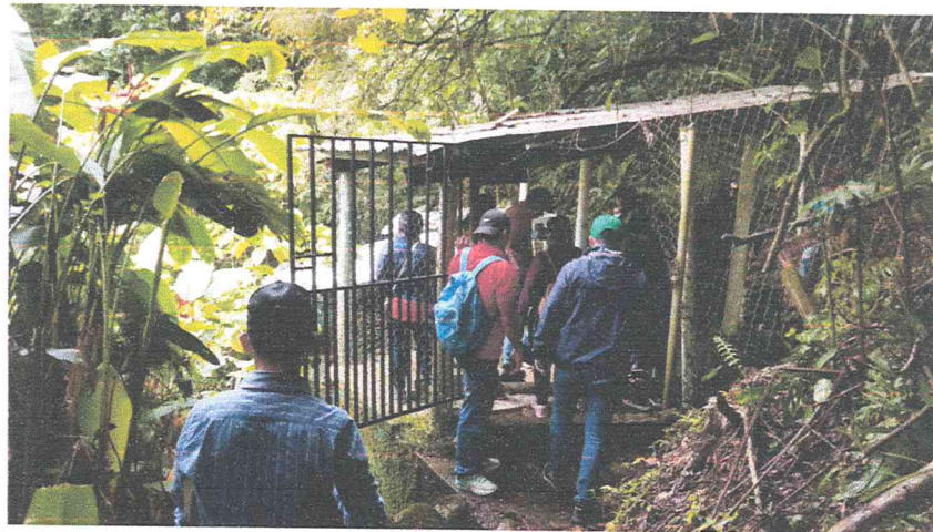
Ilustración 6 día de campo capacitación aguas de Marcala