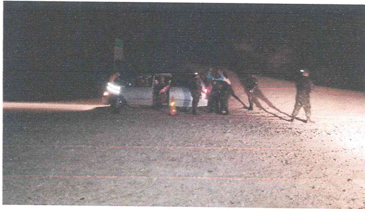
Ilustración 15 operativos nocturnos