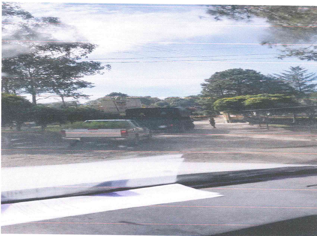
Ilustración 7 día de reforestación en coordinación con decimo batallón