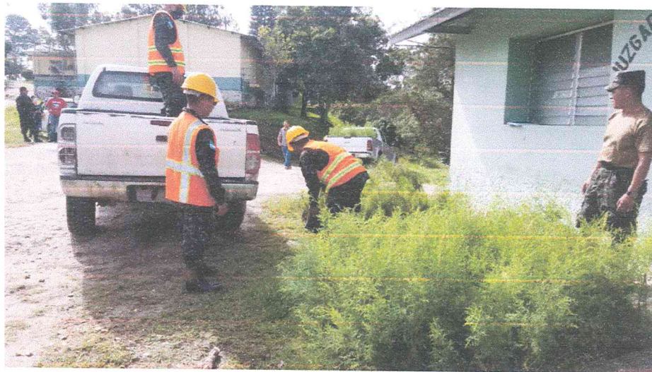
Ilustración 8 reforestación día del árbol