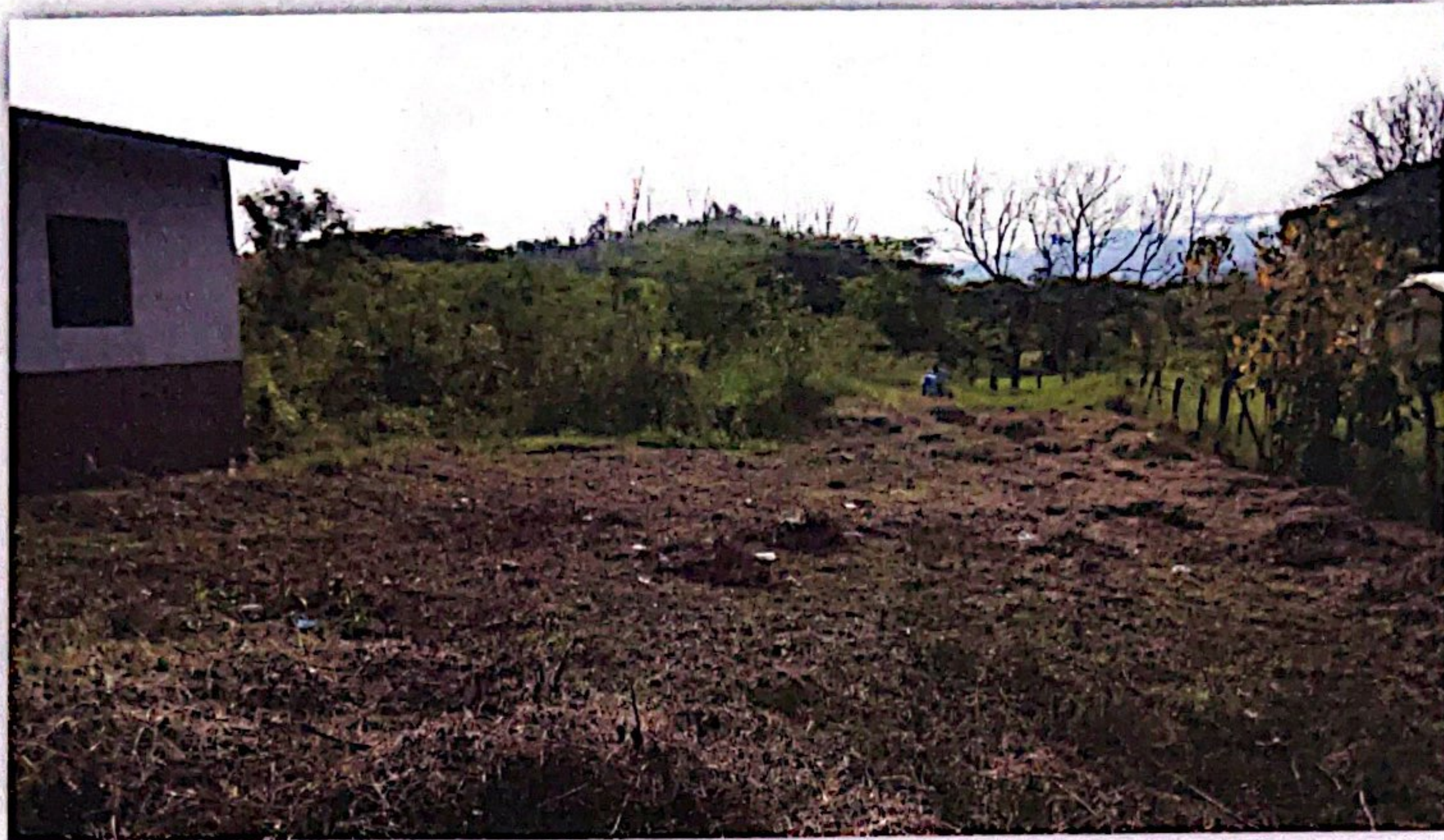
(jornales en centro de salud )