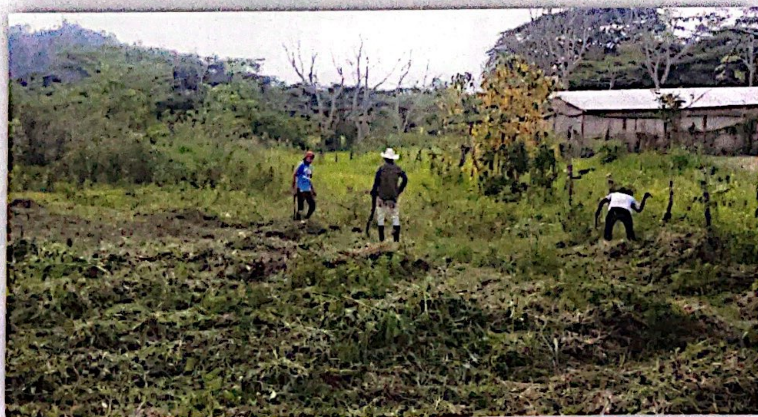
(jornales en centro de salud, trabajo en cuneta frente al Instituto san pedro, Sabana de San Pedro, avisos de tributaria móvil.)