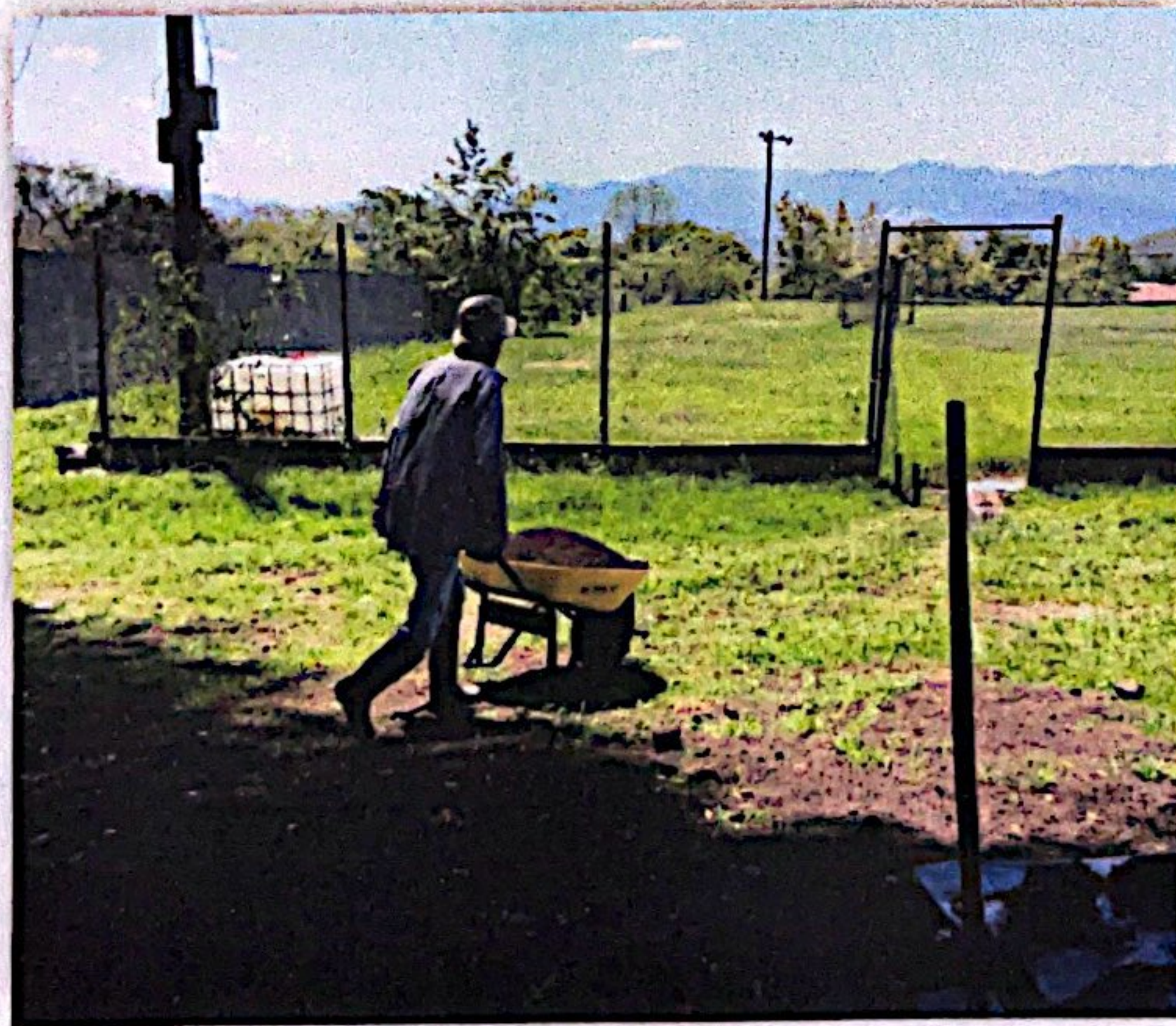
(jornal del estadio de yorito)