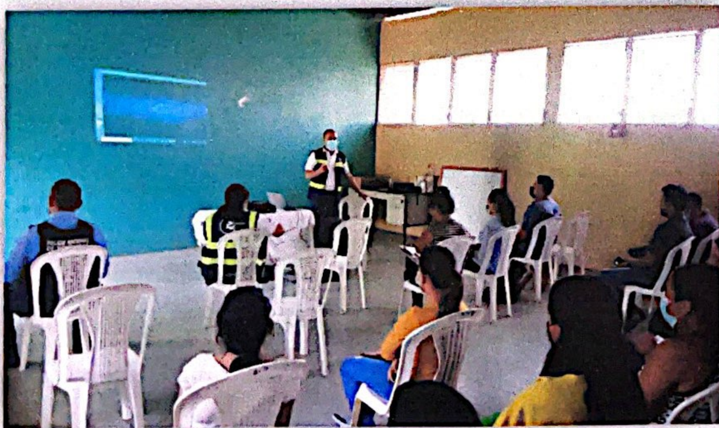
(supervisión de jornales en centro de salud, Biblioteca del ISP reunión.)