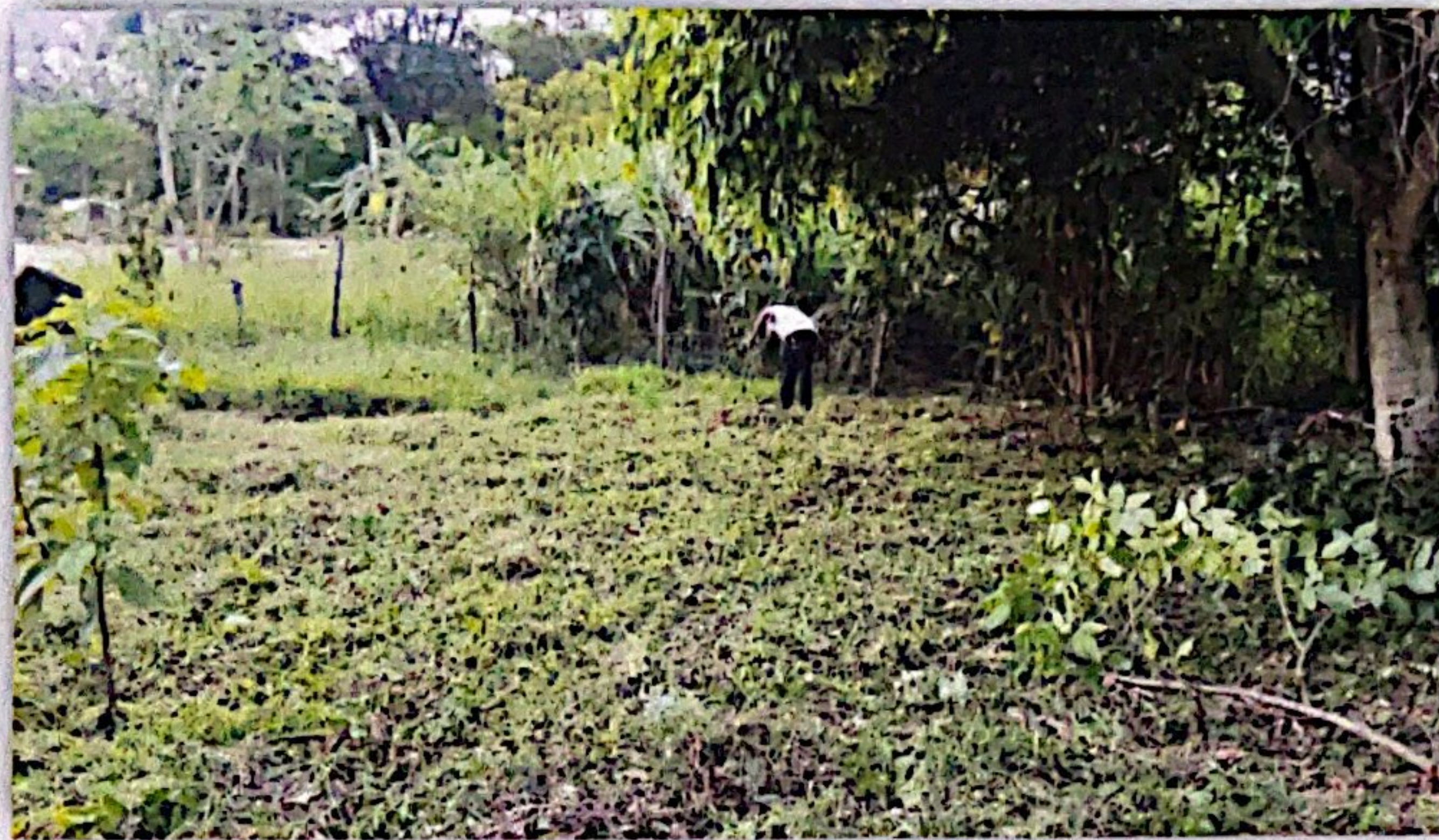
(Yorito, supervisión de jornales en centro de salud)