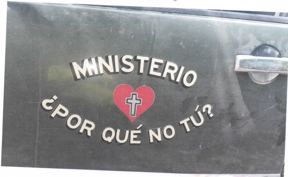
Comunidad de Buenos Aires con Proyecto Youngberg.