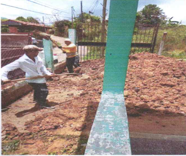
Clínica odontológica Aldea el Chimbo