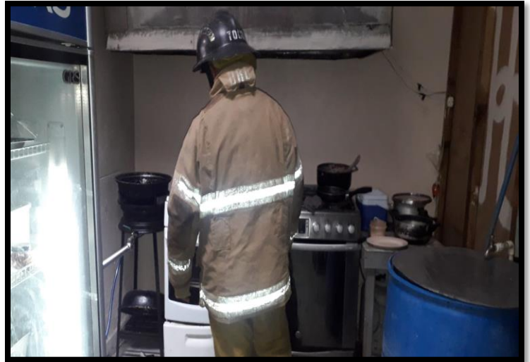
Fuga de Gas LP