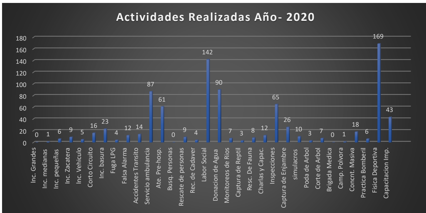
Gráfico de Emergencias Atendidas en el año 2020

En listado anterior se detalla algunas actividades que el cuerpo de Bomberos de Tocoa, realizó durante el año 2020, detallando cada una por mes, y al final el total por el año.