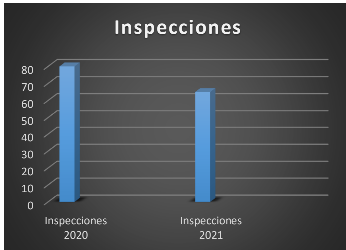
Grafico comparativo de Inspecciones Anual 2020-2021

El servicio de inspecciones realizadas a diferentes Instituciones privadas y públicos han disminuido para este año.