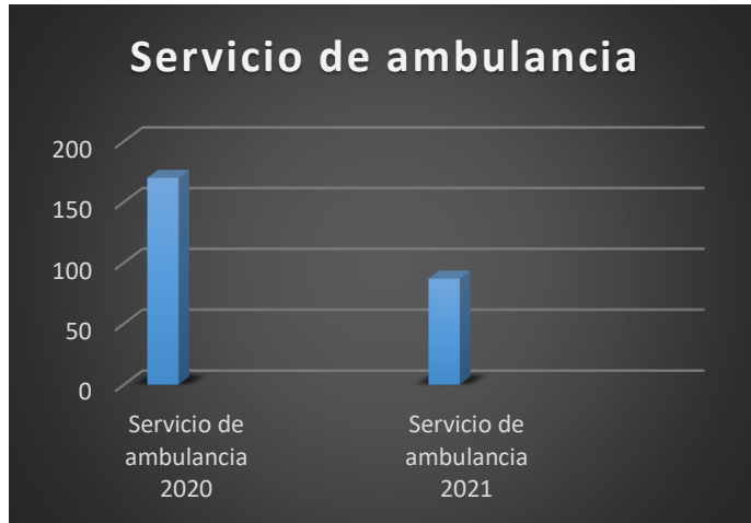
Grafico Comparativo de Servicios de Ambulancias 2020-2021

En el año 2020 la emergencia atendida en cuanto a servicios de ambulancia, fue superior al año 2021