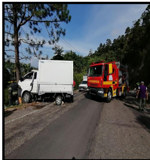
ACCIDENTE TIPO COLISION