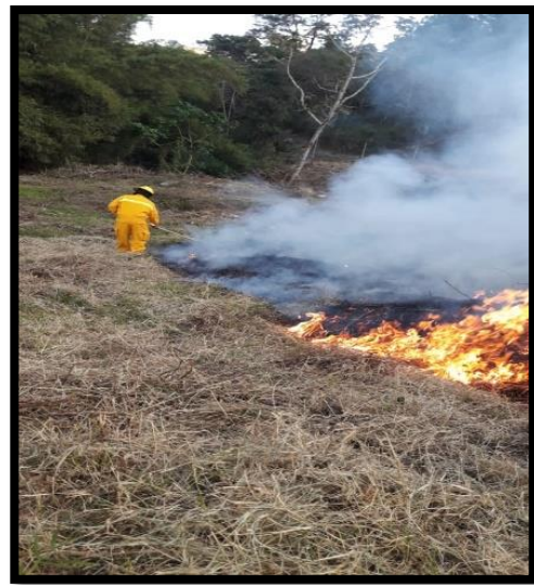
INCENDIO EN ZACATERA