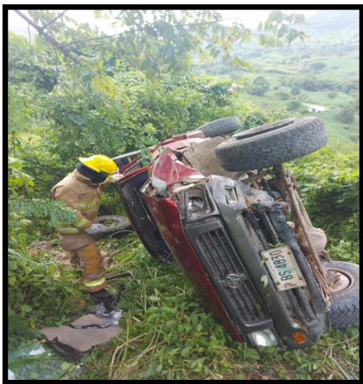
ACCIDENTE TIPO VOLCAMIENTO