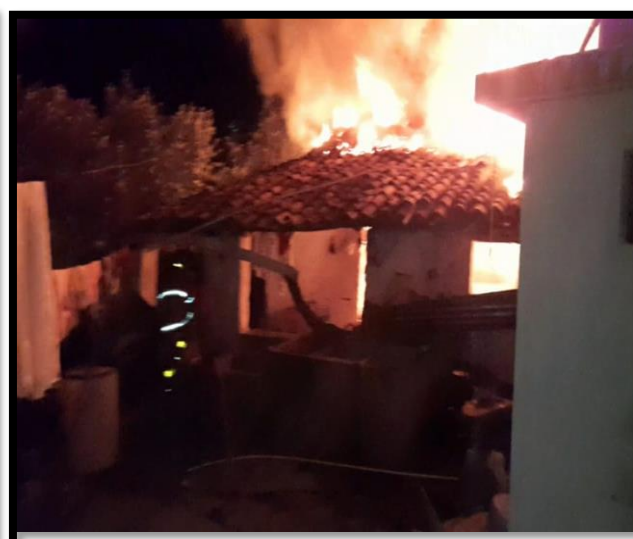
INCENDIO DECLARADO (Casa de Habitación)