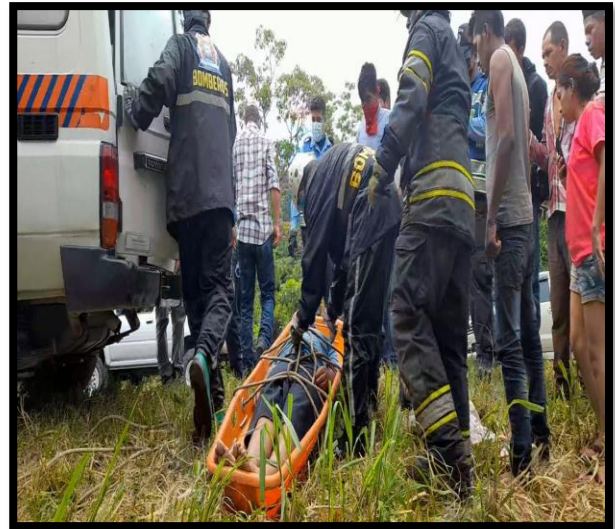
RECUPERACION DE CADAVER POR SUMERSION