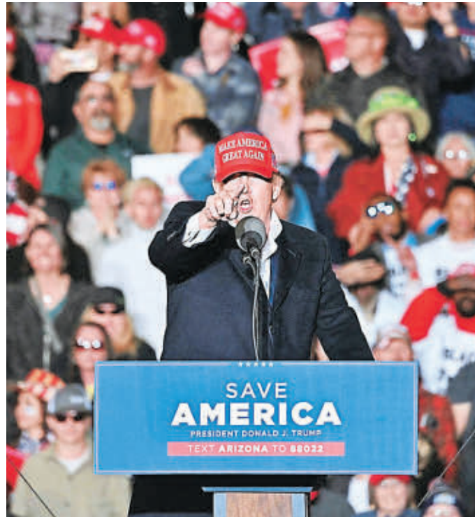
FIGURA. Trump mantiene el control sobre el Partido Republicano y muchos legisladores buscan su respaldo para las elecciones.

y en la inflación, el volumen de contagios causado por la variante ómicron y su intento de forzar a vacunarse a la mayoría de los trabajadores de empresas privadas del país. "Demócratas radicales, dejen a nuestros niños tranquilos con su poderoso sistema inmune", clamó Trump.