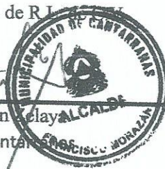
Marco Antonio Guzman Alcalde Municipal de Cantarranas