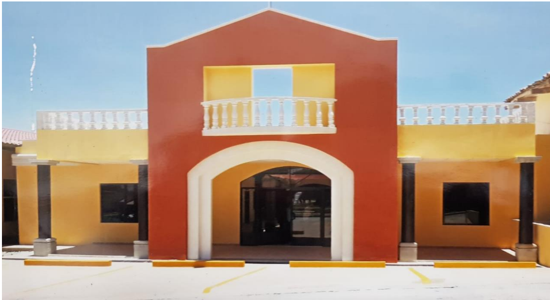
Edificio Municipal. Vigente para el año 2022