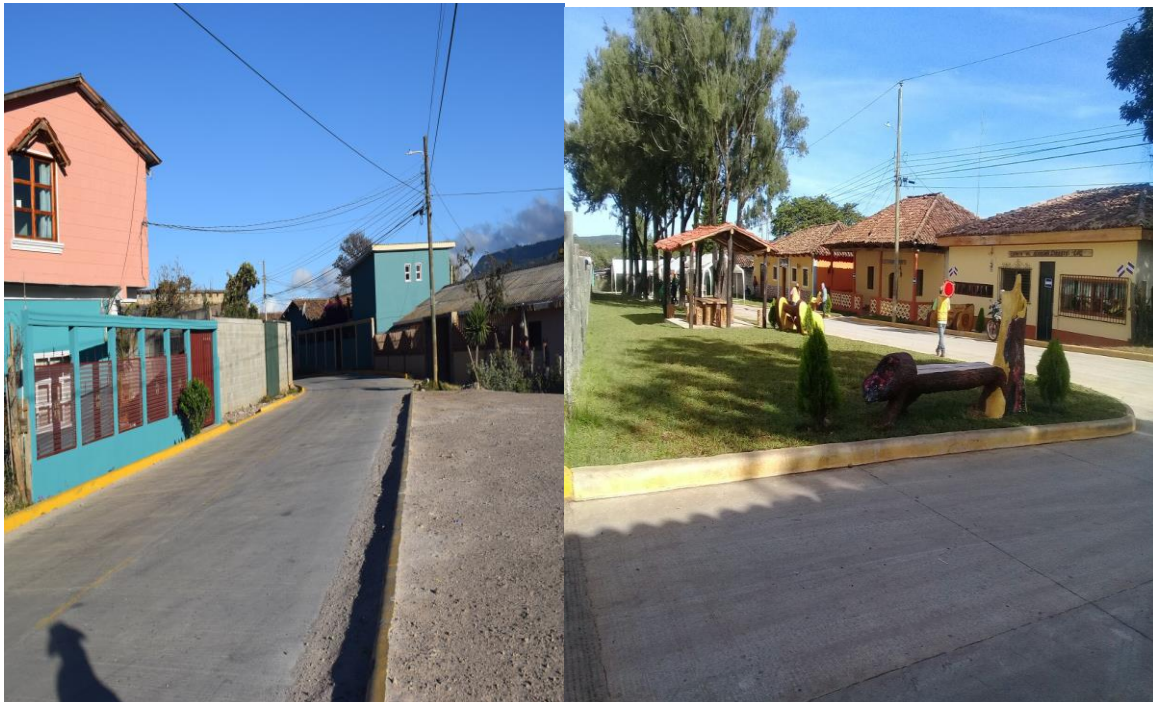
Construcción de áreas verdes en la calle saludable

Barrio San Carlos Frente a Parque El Bosque Tel: 2783 8080